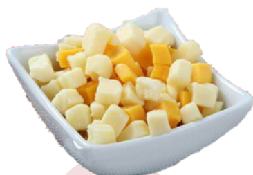
QUESO GOUDA - CHEDDAR DADOS (Bolsa 1 kg)