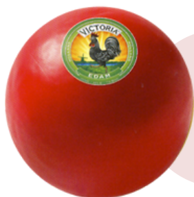
QUESO DE VACA BOLA EDAM (3 kg aprox.)