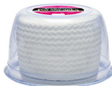
QUESO FRESCO DE CABRA Y VACA (2 kg)