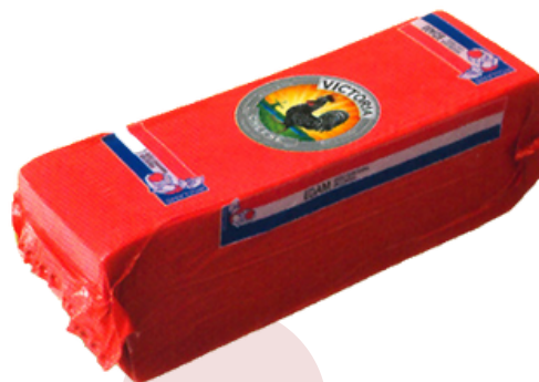
QUESO DE VACA BARRA EDAM (3 kg aprox.)