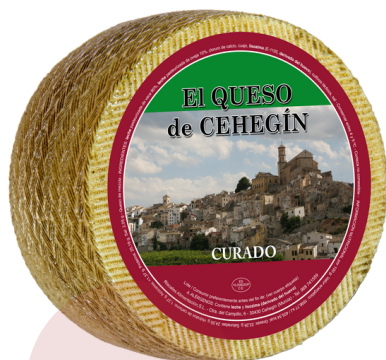
QUESO DE VACA CURADO (3 kg aprox.)