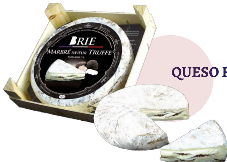
QUESO BRIE CON TRUFA (1 kg aprox.)