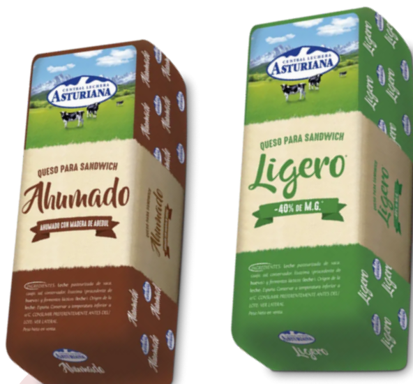
QUESO DE VACA BARRA LIGERO (3 kg aprox.)