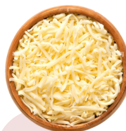
QUESO MOZZARELLA RALLADO (Bolsa 1 kg)