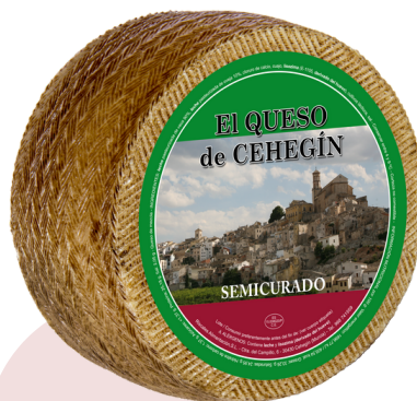
QUESO DE VACA SEMICURADO (3 kg aprox.)