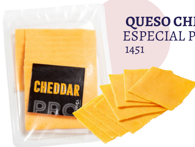
QUESO CHEDDAR LONCHEADO ESPECIAL PARA HAMBURGUESAS (Bandeja 1 kg)