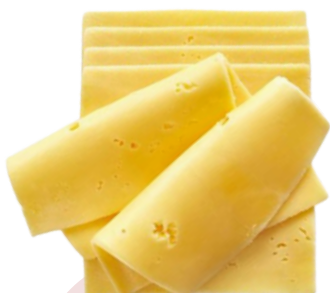
QUESO GOUDA LONCHEADO (Bandeja 1 kg)