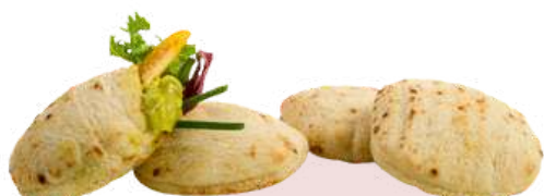
MINI PITA ❄️ 1173 (18 g - Caja 220 uds)