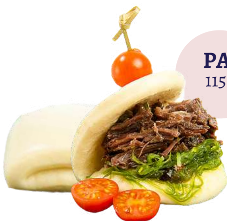
PAN BAO ❄️ 1152 (Bolsa 20 uds)