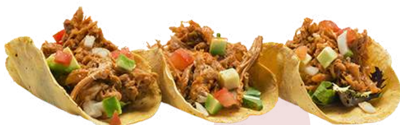
PULLED DE POLLO ❄️ (Bolsa 850g - Caja 5 bolsas)