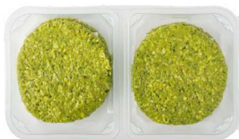
HAMBURGUESA DE POLLO Y ESPINACAS