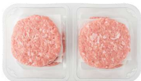
HAMBURGUESA DE PAVO Y POLLO (Bandeja 540 g - 6 uds)