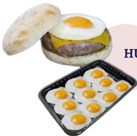
HUEVOS FRITOS ❄️ (Bandeja 10 uds - Caja 10 bandejas)