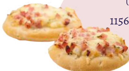
MINI PIZZA ESPONJOSA ❄️ (30 g - Bolsa 40 uds - Caja 4 bolsas) 1156 ● Prosciutto ● Salami ● Espinacas