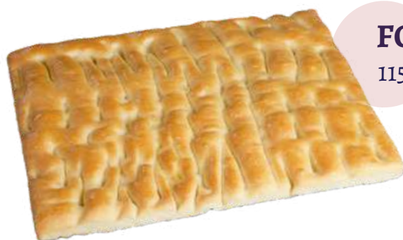
FOCACCIA TRADICIONAL ❄️ 1155 (600 g - Bolsa 4 uds)