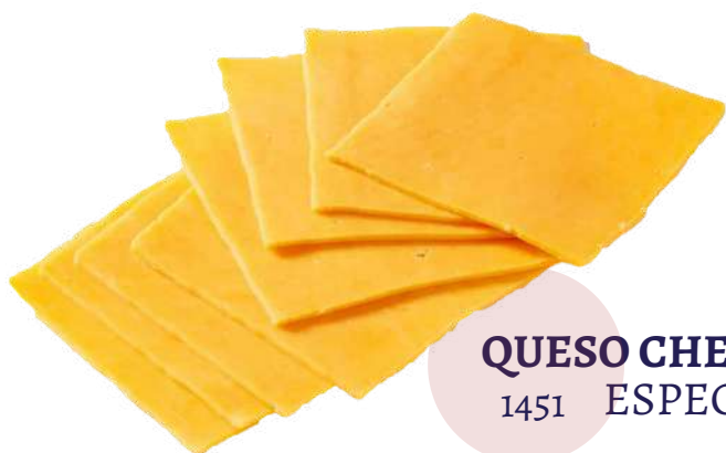
QUESO CHEDDAR LONCHEADO 1451 ESPECIAL PARA HAMBURGUESAS (Bandeja 1 kg)