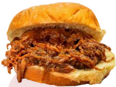
PULLED PORK ❄️ 599 (Bolsa 500 g)