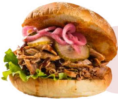
PULLED PORK BBQ ❄️ (Bolsa 850 g - Caja 5 bolsas)