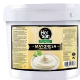
MAYONESA 1526 (3,6 l)