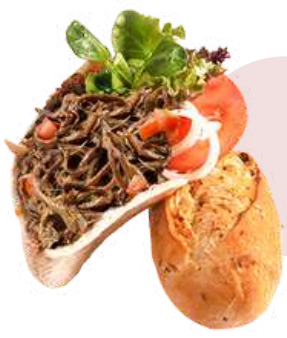
PULLED DE RABO DE VACUNO ❄️ 1333 (Bolsa 850 g - Caja 5 bolsas)