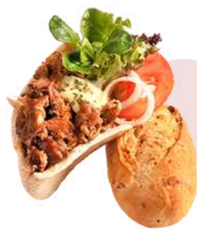
PULLED BEEF DE TERNERA ❄️ (Bolsa 850 g - Caja 5 bolsas)