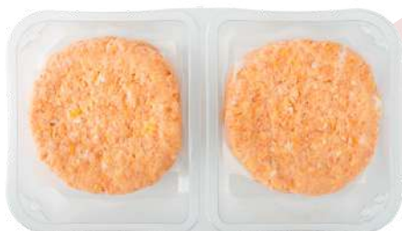
HAMBURGUESA DE POLLO DE CORRAL Y RULO DE CABRA