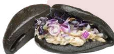
❄️ MINI PAN BAO NEGRO (Bolsa 50 uds)