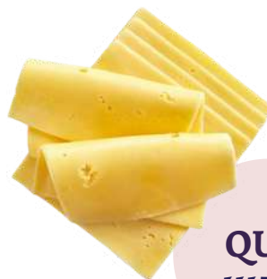
QUESO GOUDA LONCHEADO 1117 (Bandeja 1 kg)