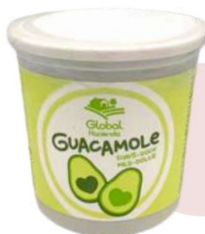
GUACAMOLE SUAVE TRADICIONAL 1660 ❄️ (950 g)