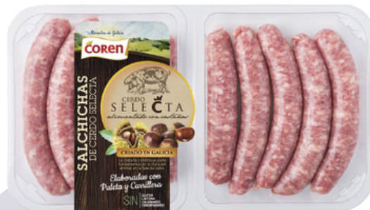
SALCHICHAS CERDO 378 SELECTA DE CASTAÑA