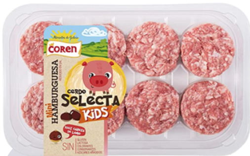
MINI HAMBURGUESAS CERDO SELECTA DE CASTAÑA