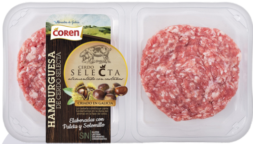
HAMBURGUESA CERDO 735 SELECTA DE CASTAÑA