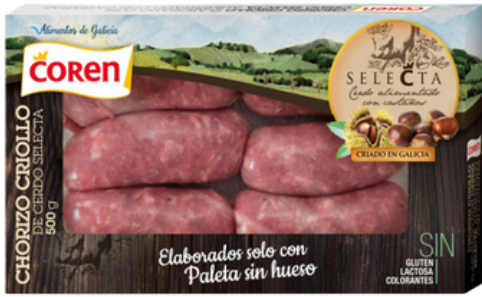
CHORIZOS CRIOLLOS CERDO SELECTA DE CASTAÑA