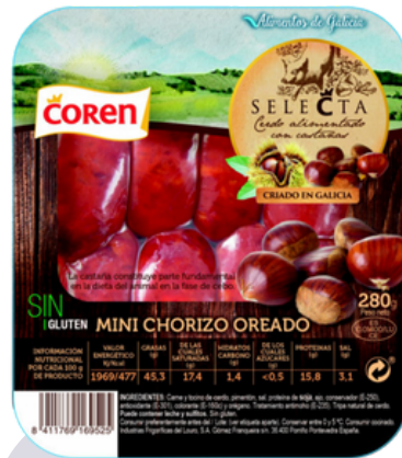
MINI CHORIZO OREADO 381 CERDO SELECTA DE CASTAÑA