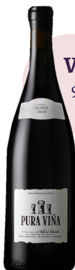
VINO TINTO PURA VIÑA 998 PARAJE NORTE VARIETAL: MONASTRELL (75 cl)