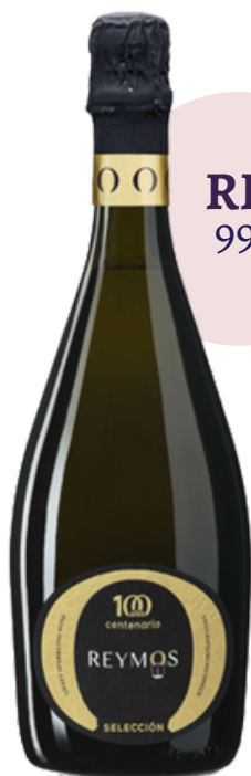
REYMO'S SELECCIÓN 999 CENTENARIO DULCE (75 cl)