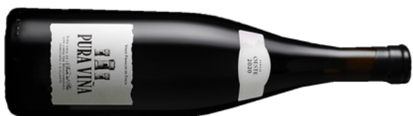
VINO TINTO PURA VIÑA 997 PARAJE OESTE VARIETAL: MONASTRELL (75 cl)