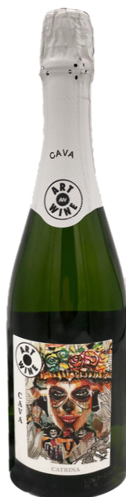
CAVA CATRINA 995 (75 cl)