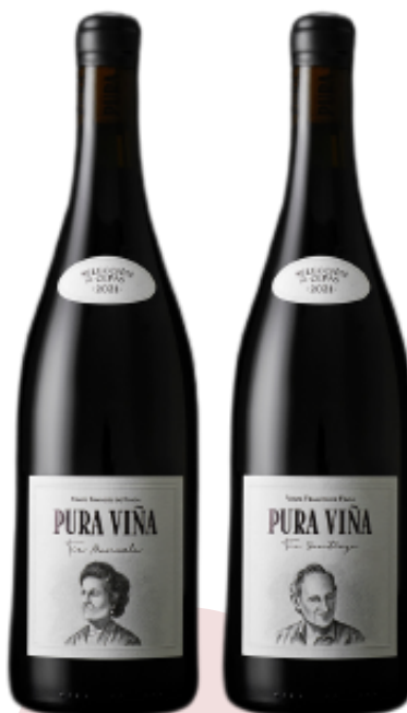
VINO TINTO PURA VIÑA VARIETAL: MONSATRELL (75 cl)