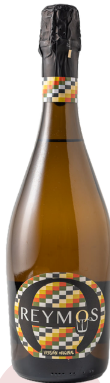
REYMO'S CLASSIC 924 (75 cl)