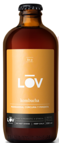
KOMBUCHA K03 MANDARINA, 1678 CURCUMA Y PIMIENTA (330 ml - Caja 18 uds)