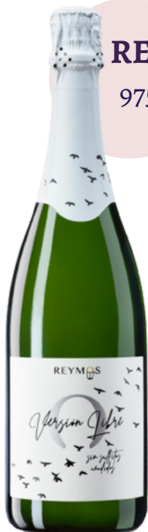
REYMO'S BRUT NATURE 975 VERSIÓN LIBRE (75 cl)