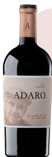
VINO TINTO PRADOREY 908 ADARO VARIETAL: TEMPRANILLO (75 cl)