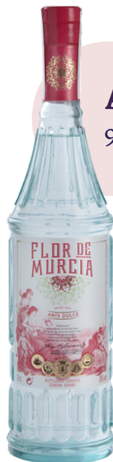
ANIS DULCE 950 FLOR DE MURCIA (70 cl)