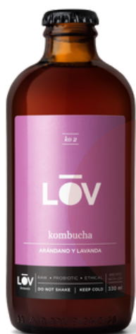
KOMBUCHA K02 LAVANDA Y 1677 ARANDANOS (330 ml - Caja 18 uds)