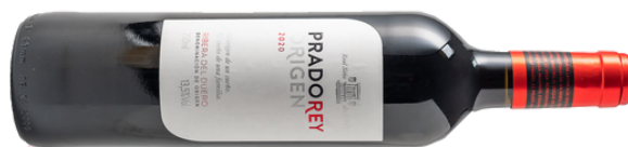
VINO TINTO PRADOREY 901 ORIGEN ROBLE VARIETAL: TEMPRANILLO, MERLOT Y CABERNET SAUVIGNON (75 cl)