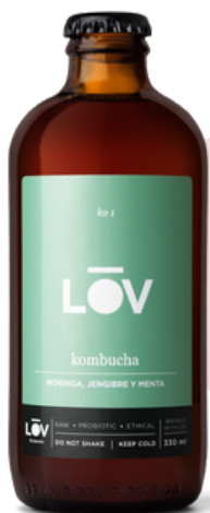
KOMBUCHA K01 MORINGA, 1670 JENGIBRE Y MENTA (330 ml - Caja 18 uds)