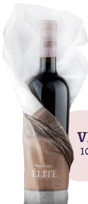
VINO TINTO PRADOREY ÉLITE 1033 VARIETAL: TEMPRANILLO CLON ÉLITE (75 cl)