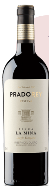
VINO PRADOREY LA MINA 915 VARIETAL: TEMPRANILLO (75 cl)