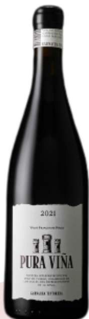
VINO TINTO PURA VIÑA 982 GARNACHA TINTORERA VARIETAL: GARNACHA TINTORERA (75 cl)