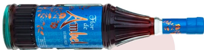
VERMÚ FLOR DE AMBEL 951 (70 cl)