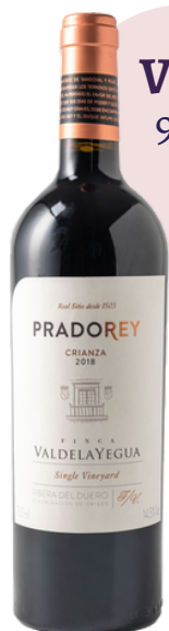
VINO TINTO PRADOREY 906 CRIANZA VARIETAL: TEMPRANILLO Y MERLOT (75 cl)