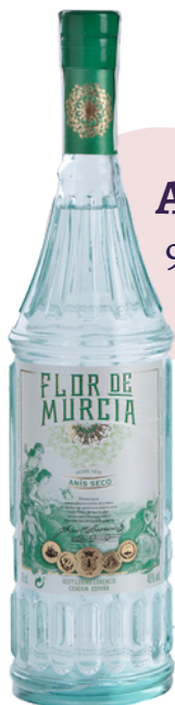
ANIS SECO 970 FLOR DE MURCIA (70 cl)