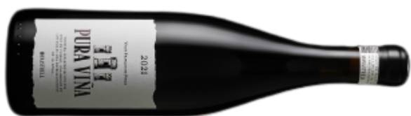
VINO TINTO PURA VIÑA 996 MONASTRELL VARIETAL: MONASTRELL (75 cl)