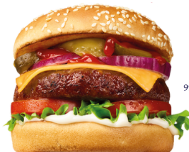
99 HAMBURGUESA VEGANA IMITACIÓN VACUNO 170 G/UD 3,06KG (18 UDS)