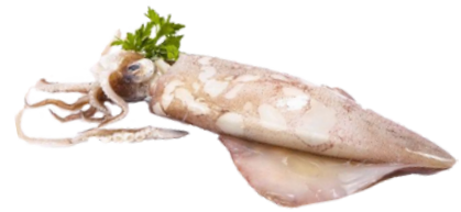
CALAMAR NACIONAL P