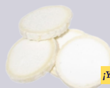
MEDALLÓN RULO DE CABRA 1945 50 G (75 mm) 1 KG