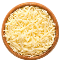
QUESO MOZZARRELLA RALLADO 1946 2 KG