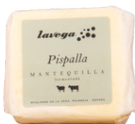
MANTEQUILLA PISPALLA 1755 250 G/UD 8 UDS