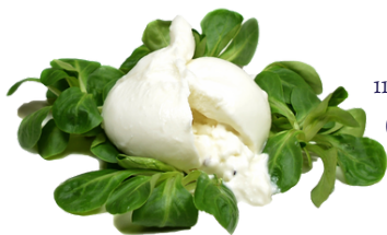
BURRATA CON TRUFA 1145 200 G/UD 10 UDS ❄️