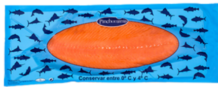
1643 PLANCHA SALMÓN AHUMADO PRECORTADO