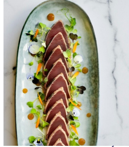
TATAKI DE ATÚN JAPONÉS