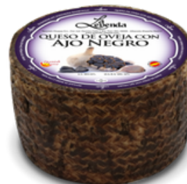
QUESO OVEJA CURADO CON AJO NEGRO 1122 2,5 KG APROX