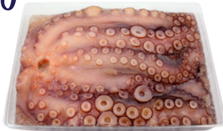
PULPO PREMIUM 500/1000