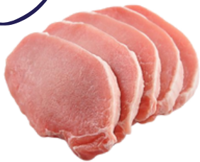
LOMO CERDO FILETEADO 5_F_CONG CONGELADO ❄️