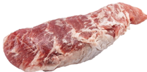
PLUMA CERDO DUROC 172 CONGELADA ❄️