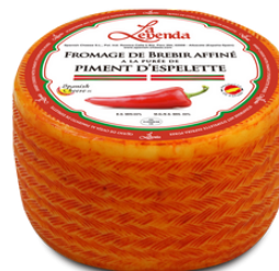
QUESO OVEJA CURADO CON PIMIENTO DE ESPELETTE 151 3 KG APROX