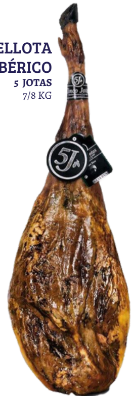
JAMÓN BELLOTA 100% IBÉRICO 261 5 JOTAS 7/8 KG