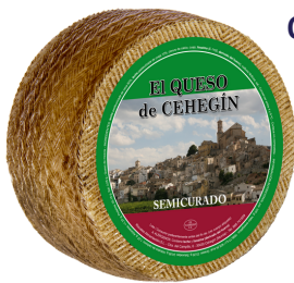
QUESO DE CEHEGIN SEMICURADO 621 3 KG APROX