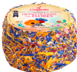
QUESO OVEJA CURADO CON FLORES 135 3 KG APROX