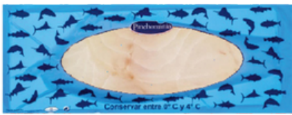
1644 PLANCHA BACALAO AHUMADO PRECORTADO