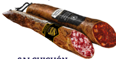
372 SALCHICHÓN IBÉRICO 100% BELLOTA CAMPAÑA SÁNCHEZ ALCARAZ 500 G