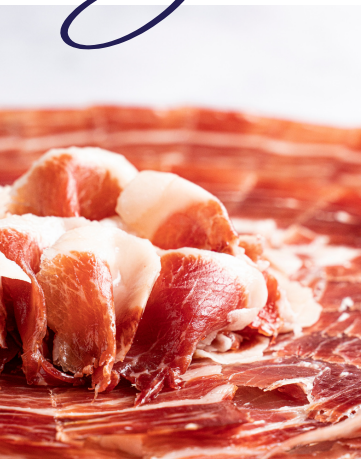
JAMÓN BELLOTA 100% IBÉRICO CORTADO A CUCHILLO DEHESA LAS CUMBRES