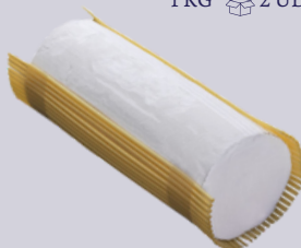
RULO CABRA PURO 1949 1 KG 2 UDS