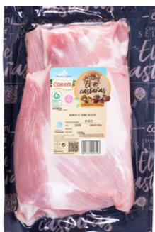
SECRETO CERDO SELECTA 163 ALIMENTADO CON CASTAÑA