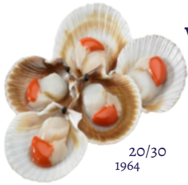
VIEIRA DEL PACÍFICO