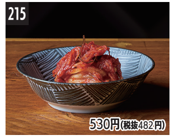
215 530円(税抜482円) 乳酸发酵的暴腌泡菜 乳酸發酵而成的韓式泡菜醃漬物 젓산 발효 걸절이 김치