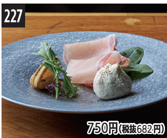
227 750円(税抜682円) 熟成生火腿、熏制腌萝卜和奶油奶酪 熟成生火腿&煙燻蘿蔔醃漬物&奶油乳酪 숙성 생햄과 이부리갓코와 크림치즈