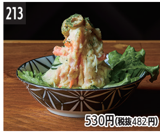
213 530円(税抜482円) 米三角の土豆沙拉 米三角馬鈴薯沙拉 #01 코메 산카쿠 감자 샐러드 #01