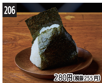
206 盐曲饭团 鹽麴飯團 소금 누룩 주먹밥