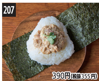
207 芥末蛋黄酱金枪鱼饭团 芥末美乃茲鮭魚飯團 와사비마요 참치 주먹밥