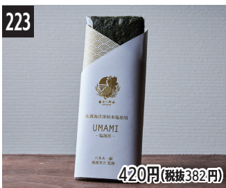
223 420円(税抜382円) 鲜香熟成海苔 (使用佐渡市的深层海水) 美味熟成海苔 (用佐渡深層海洋水製成) 감칠맛 숙성 김 (사토의 해양심층수 사용)