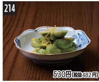
214 530円(税抜482円) 丰洲吉冈屋生榨菜 豊洲吉岡屋の生榨菜 도요스 요시오카야의 생 자차이