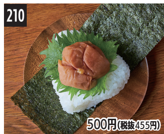
210 无添加熟成梅子 無添加熟成梅 무첨가 숙성 매실