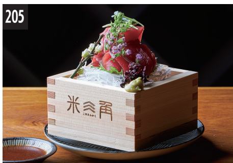
205 今天的生鱼片 (红) ~ 配曲酱油 ~ 今日의 生魚片 (紅) ~ 配曲醬油 ~ 오늘의 사시미 (붉은색) ~ 누룩 간장으로 ~

今天推荐的海鲜菜单请参阅牧物菜单 今天推薦的海鮮菜單請參閱牧物菜單 오늘의 추천 해물 메뉴는, 두루마리 메뉴를 봐 주세요