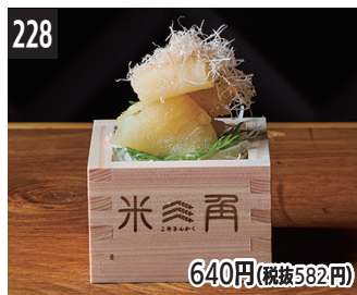
228 640円(税抜582円) 鲑鱼风味熟成高汤酱油腌鲑鱼子 熟成湯汁醬油調味而成的鮭魚卵醃漬物 숙성 육수 간장 청어알 도사즈케