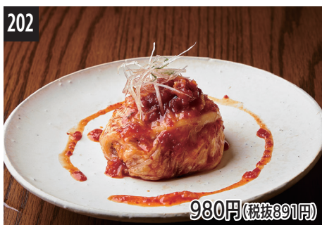
202 芝士和生拌金枪鱼肉的泡菜大王 生拌鮭魚和乳酪的國王韓式泡菜 치즈와 참치육회의 왕김치