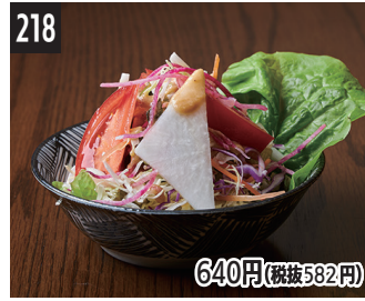
218 640円(税抜582円) 米三角的沙拉 米三角沙拉 고메 산카쿠 샐러드