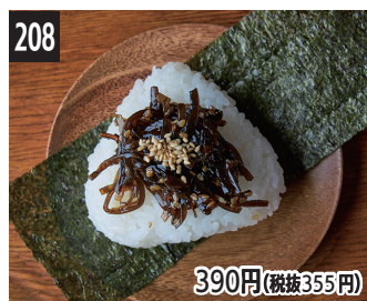
208 芝麻盐曲海带 芝麻鹽麴昆布 깨소금 누룩 다시마