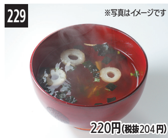
229 220円(税抜204円) 赤鯧盐汤 赤鯧鹽湯 눈볼대 국물 소금 스프