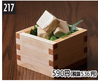
217 590円(税抜536円) 酒曲味噌腌豆腐 味噌噌豆腐 두부 누룩 된장 절임