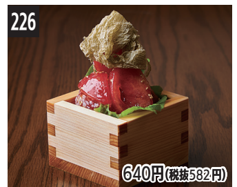
226 640円(税抜582円) 熟成番茄韩式拌菜加薯蕷昆布 熟成韓式涼拌蕃茄 山芋昆布 숙성 토마토 나물 도로로 다시마