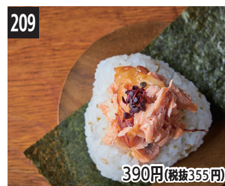
209 橄榄和熟成鲑鱼 橄欖和熟成鮭魚 올리브와 숙성 연어