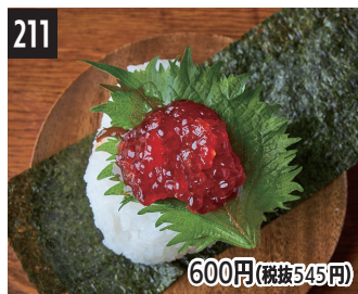
211 二年熟成酱油腌鲑鱼子 兩年熟成醬油生筋子 2년 숙성 간장의 연어 알젓