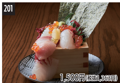
201 今日海鲜满溢饭团 今日의 海鮮三角飯團 오늘의 호화 해산물 주먹밥