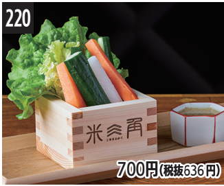
220 700円(税抜636円) 蔬菜棍蘸发酵热酱 蔬菜棒沾發酵熱醬 스틱 아재 발효 바나 카우다