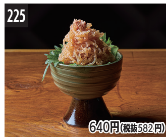
225 640円(税抜582円) 熟成酱油的鲑鱼子魔芋丝 熟成湯汁醬油調味而成的鱈魚卵拌蒟蒻絲 숙성 간장의 명란젓 시라타키