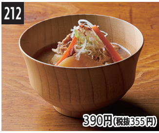
212 390円(税抜355円) 配料丰富的上品酒曲味噌汤 最上等麴味噌料多味噌湯 최상급 누룩 된장의 건더기 가득한 된장국