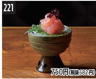
221 750円(税抜682円) 酒曲盐腌新泻甜虾 新潟甜蝦醃漬物 니가타 단새우 누룩젓