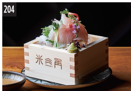
204 今天的生鱼片 (白) ~ 配麴橙汁 ~ 今日의 生魚片 (白) ~ 配麴橙汁 ~ 오늘의 사시미 (흰색) ~ 누룩 폰 식초에서 ~