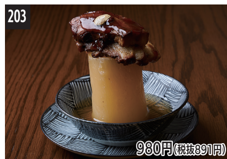
203 熬煮六白黑猪肉 鹿兒島產六白黑豬的軟嫩燉肉 롯데쿠 흑돼지 사르르 조림