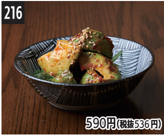
216 590円(税抜536円) 发酵酒曲辣油浇牛油果 發酵麴辣椒油凉拌酪梨 고추기름을 뿌린 아보가도 발효 누룩