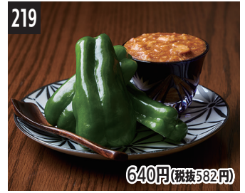
219 640円(税抜582円) 生青椒肉末发酵黄油 生青椒拌肉燥發酵奶油 생피망 소보로 발효 버터