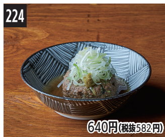
224 640円(税抜582円) 自制柚子胡椒风味熟成鱼丸 自家製熟成魚丸柚子胡椒口味 수제 숙성 쓰미레(어묵 경단) 유자 후추 스타일