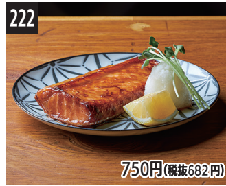
222 750円(税抜682円) 盐曲烤爽弹鲑鱼腹 鹽麴香烤 Q 彈鮭魚肚條 탱탱한 연어뱃살 소금 누룩 구이

如果点饭团，配料丰富的 上品酒曲味噌汤可享受 100 日元的折扣！ 點完三角飯團後，最上等 麴味噌料多味噌湯可折扣 100 日元！ 주먹밥 주문하면 최상급 누룩 된장의 건더기 가득한 된장국 100원 할인!