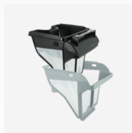
Filterbak Dubbel filter: 150/60 µ