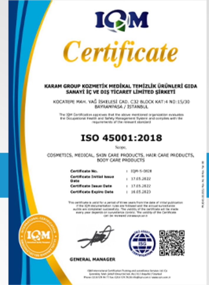
Uluslararası Sağlık ve Güvenlik Sertifikası