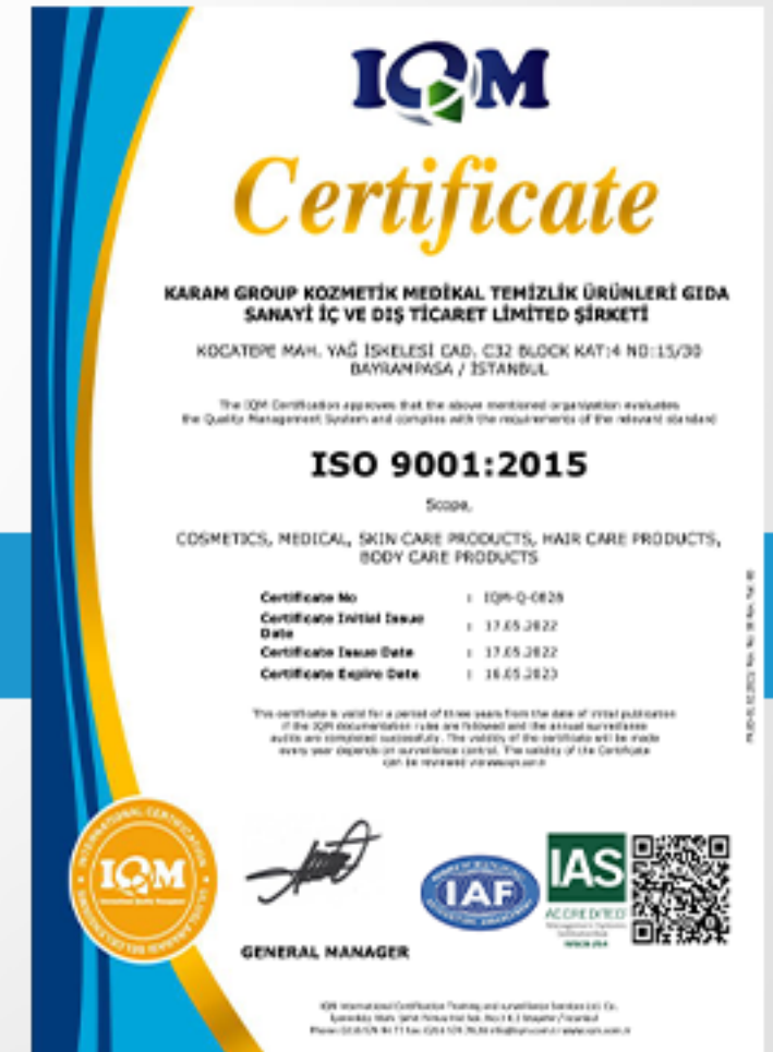
Ürün kalite belgesi