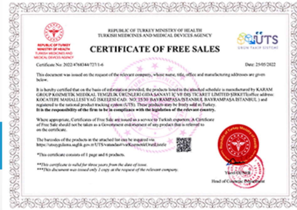
Sağlık Bakanlığı ruhsatı