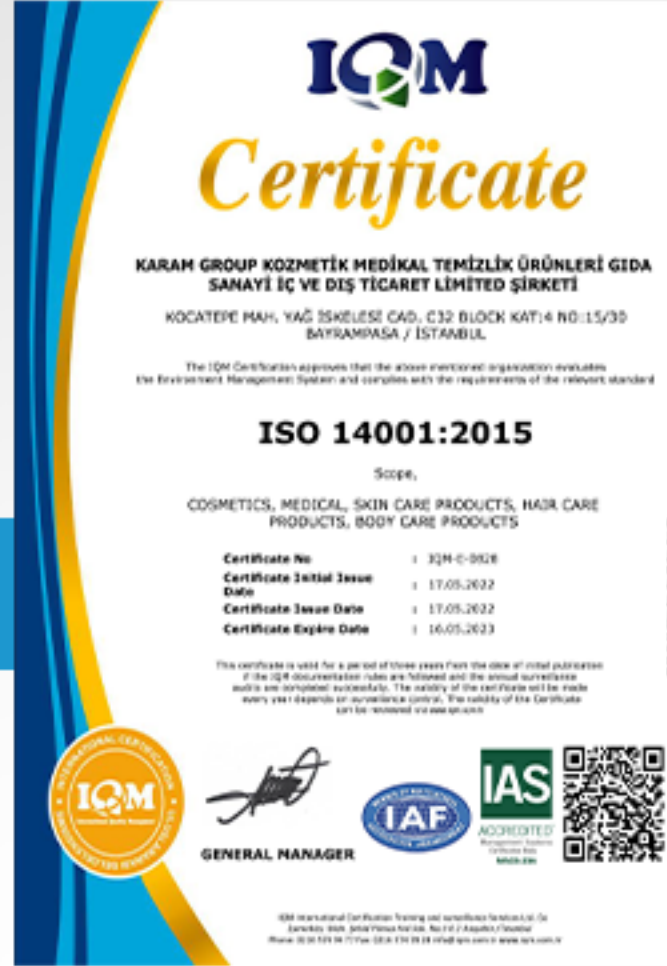
Çevreye zarar vermeme belgesi