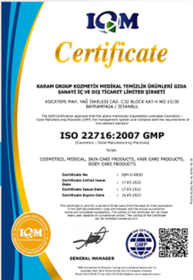
Üretim kalite belgesi