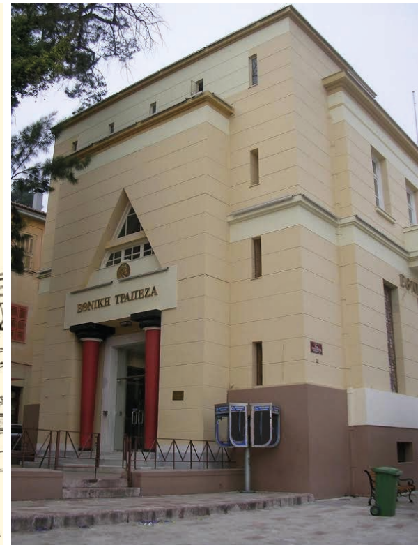
Δεξιά: Η είσοδος στο υποκατάστημα Ναυπλίου παραπέμπει ευθέως στην πρόσοψη του θολωτού τάφου του Ατρέα στις Μυκίνες (Ι.Α./Ε.Τ.Ε.) Αριστερά: Αναπαράσταση του κτιρίου (Σπανού, Σπίνου, 2011)