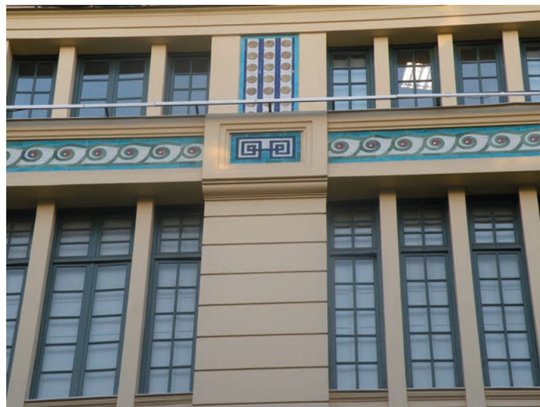
Το κτίριο των Αρχείων Ε.Τ.Ε. (1923-1925)