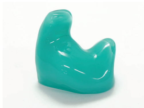
ターコイズシェル