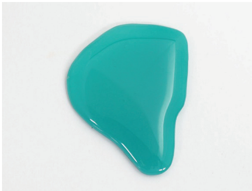
ターコイズフェイスプレート

カナルワークスのシェル及びフェイスプレートのカラーは 25 色よりご選択いただけましたが、この度、新色として“ターコイズ”を追加いたします。