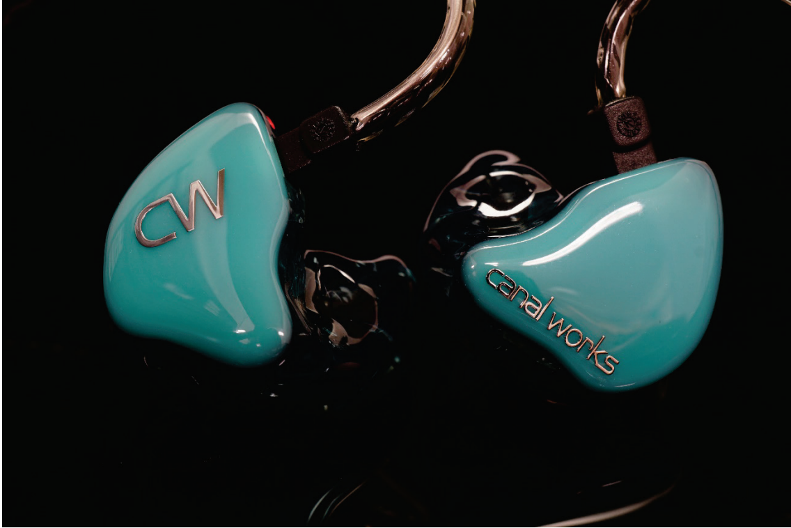
2ウェイ/3ドライバ カスタムイヤーマニター CW-L15LV ※新色：ターコイズ