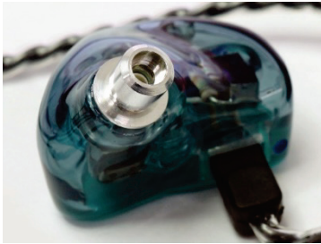
アルミ削り出しノズル

ノズルは国内生産によるアルミの削り出し品を採用しています。高い精度と仕上がりの美しさで安定した音質と所有する喜びを感じられます。