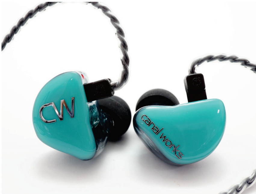
2ウェイ/3ドライバ ユニバーサルイヤーマニター CW-U15LV