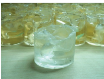
カナルワークスで保管している耳型

シェルの透明度などカスタム IEM の仕上がりの品質ではご好評をいただいておりますが、ユニバーサルモデルでもカスタムと同じように一つ一つハンドメイドで製作しています。シェルの形状については今まで数多くの耳型と向き合ってきた経験と資産を活かし、より多くの方にフィットする形状を実現しました。