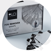
Foil di alluminio con Pad di cotone pressato