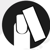
Blocco finitore (buffer)