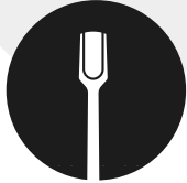
Spingi cuticole o bastoncino d'arancio