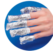
Impacco con foil di alluminio