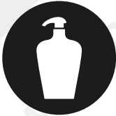
Disinfettante (es. Amuchina diluita)