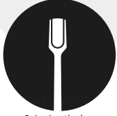
Spingi cuticole o bastoncino d'arancio