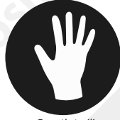
Guanti sterili senza TALCO