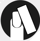
Blocco finitore (buffer)