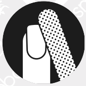
Lima grana 100/180