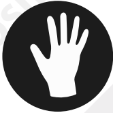
Guanti sterili senza TALCO