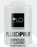
FLUIDPRO Cleaner and Remover