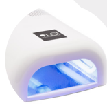
Lampada UV o LED 36 W o superiore