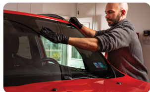
Procéder au polissage mouillé en faisant des lignes droites avec le chiffon noir

Avec le chiffon en microfibre noir (fourni), essuyez en faisant des lignes droites pour retirer 95 % du produit excédentaire. Ce chiffon sera votre chiffon de polissage mouillé.