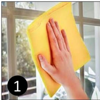
1 Reinig de ruit