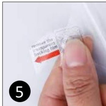
5 Plak een stukje tapje