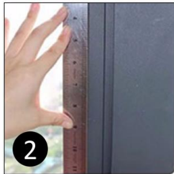
2 Meet het raam op