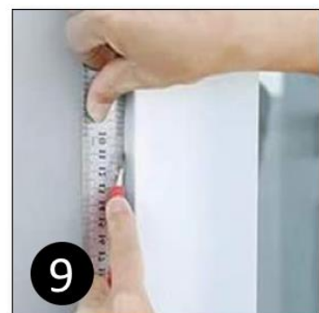
9 Snijd de folie op maat