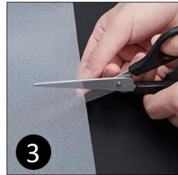
3 Knip de folie