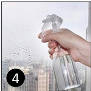
4 Maak de ruit nat