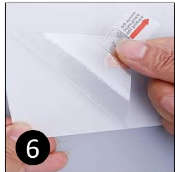
6 Verwijder beschermfolie