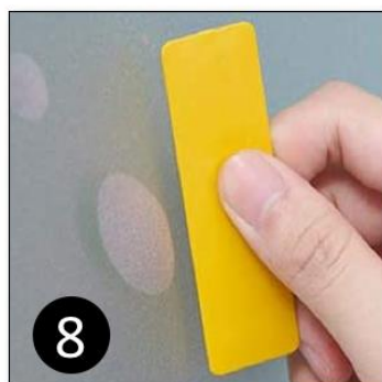
8 Verwijder de bubbels