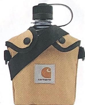
DA CAMPEGGIO , termica con rivestimento in canvas riciclato, CARHARTT euro 79.