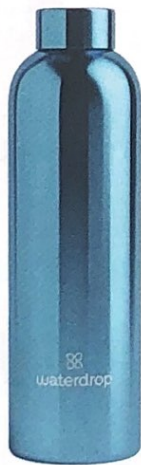
IN ACCIAIO LUCIDO si aromatizza con le capsule microdrink, WATERDROP euro 37,90.