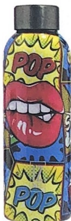
POP ART in primo piano nella water bottle Pop Lips in acciaio ultra leggero, IZMEE euro 29,50.