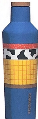
OMAGGIO al film Toy Story , per festeggiare i 100 anni della Disney, CORKICLE euro 53.