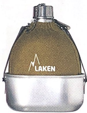
SAPORE rétro in alluminio con custodia in feltro, LAKEN su amazon.it euro 27,70.