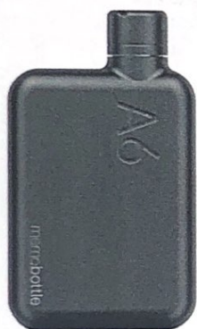
SLIM e salvaspazio, è disegnata per entrare in tutte le borse, MEMOBOTTLE euro 55.