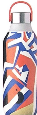
UN QUADRO di David Bomberg sulla borraccia creata con la Tate di Londra, CHILLY'S euro 41.