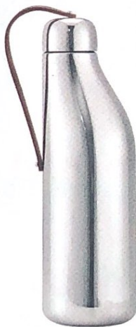
A FORMA organica, in acciaio con manico in cuoio, GEORG JENSEN euro 59.