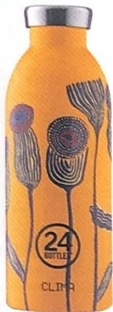
ANTISCIVOLO , ha una finitura opaca con dettagli 3D: è la Clima Bottle, 24BOTTLES euro 35.