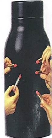
IRONICA e surreale, con rossetti, ideata da Seletti per TOILETPAPER HOME euro 39.