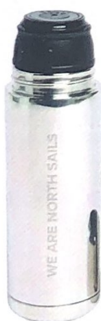
EDIZIONE LIMITATA per il thermos in acciaio inossidabile, ALESSI X NORTH SAILS euro 59.