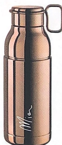
SI PORTA con un dito la plastic-free Mia Thermo, ELITE da Decathlon euro 38,99.