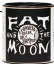
Pulverfass: Natürliches Trockenshampoo »Lavender & Cocoa« von Fat and the Moon. goodhoodstore.com