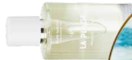
Duft der großen weiten Welt: »La Plage« mit Noten von Orangenblüte, Ingwer, Melone und Amyris. kerzon.paris