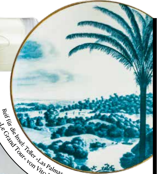
Reif für die Insel: Teller »Las Palmas« mit Goldrand, aus der Serie »Le Grand Tour« von Vito Nesta. contemporum.com/de