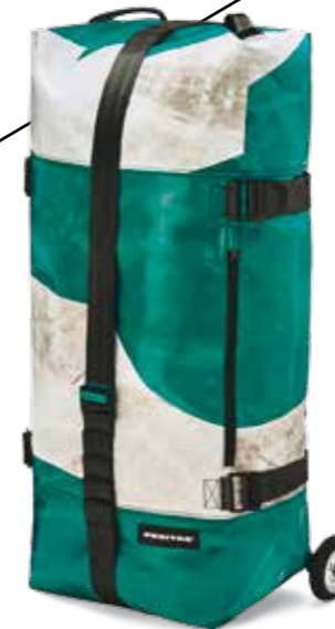
Luftschiff: Aufblasbare Reisetasche »F753 Zippelin« aus LKW-Plane, mit 85 Litern Fassungsvermögen. freitag.ch