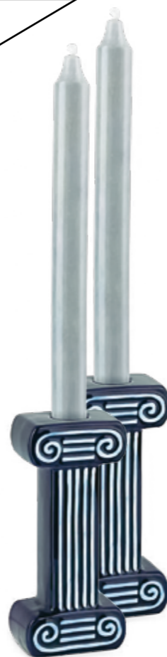
Säulenheilige: Kerzenhalter »Column Blue« aus Keramik. oliverbonas.com