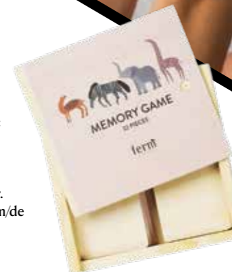
Doppelte Hinsicht: Memory-Spiel »Safari« aus Sperrholz, von Ferm Living. notanotherbill.com