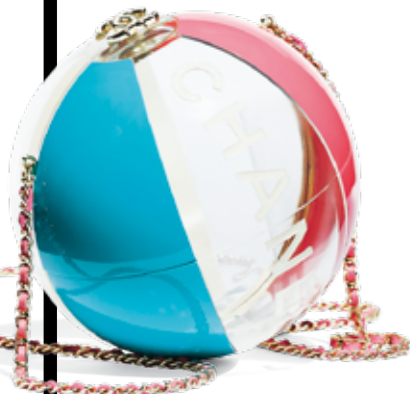
Runde ihres Herzens: Handtasche »Strandball-Minaudière« von Chanel.

Heimweh schmerzt unendlich, viel mehr als Fernweh – das hat man zimal gelesen oder erzählt bekommen. Aber ich hatte nie Heimweh, Fernweh schon. Es tut weh. Zwar ist es gerade so erträglich, ich kann mich wegkonzentrieren, doch der Schmerz ist tückisch: Kaum ist da eine Sekunde Luft, drängelt er sich nach vorn. Dann träume ich mich nach Hawaii und kichere gleich in mich hinein, denn Hawaii hat immer noch einen blöden Ruf, vielleicht weil es klingt wie ein spießbürgerlicher Traum aus den Sechzigerjahren. Ich weiß, ich soll über Vancouver fliegen, dort einen angemessenen Zwischenstopp machen, bevor es weitergeht, und dann mindestens drei Wochen lang auf Hawaii bleiben, sonst sieht man nur die üblichen amerikanischen Touristenklitschen. Ich weiß fast alles. Aber ich war noch nie da. Und ob ich es je hinbekomme, weiß ich nicht. Muss ich vielleicht nicht. Den Schmerz, der mich pikst, möchte ich gar nicht missen. Durch ihn kann ich weiter von Hawaii träumen. Aloha: Das heißt Liebe.