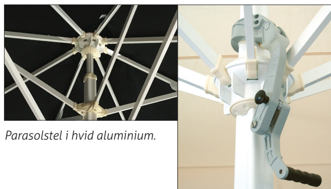
Parasolstel i hvid aluminium.