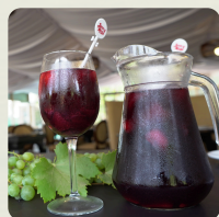
JARRO BORGOÑA 1.5 L $10.900