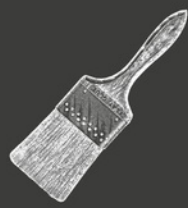
Pinceau à Colle