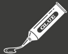
Colle à Papier Peint