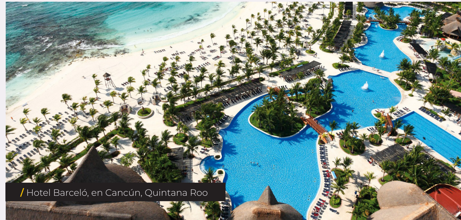
/ Hotel Barceló, en Cancún, Quintana Roo