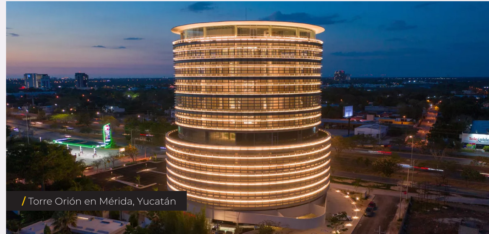
/ Torre Orión en Mérida, Yucatán

/ Suministro de los equipos de bombeo, presión constante y tubería de PVC hidráulica para la remodelación del Campo deportivo Salvador Alvarado .