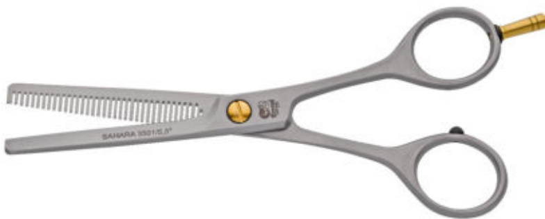
Effilierschere / Thinning scissors