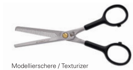
Modellierschere / Texturizer