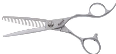
Modellierschere / Texturizer