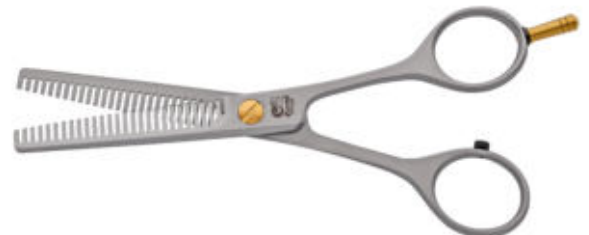
Effilierschere / Thinning scissors