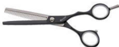
Modellierschere / Texturizer