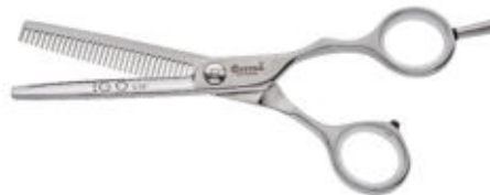
Modellierschere / Thinning Scissors