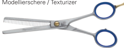
Modellierschere / Texturizer