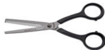
Modellierschere / Texturizer