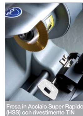
Fresa in Acciaio Super Rapido (HSS) con rivestimento TiN

Realizzata esclusivamente con materiali di qualità, è uno strumento di lunga durata, garantito a marchio CE.