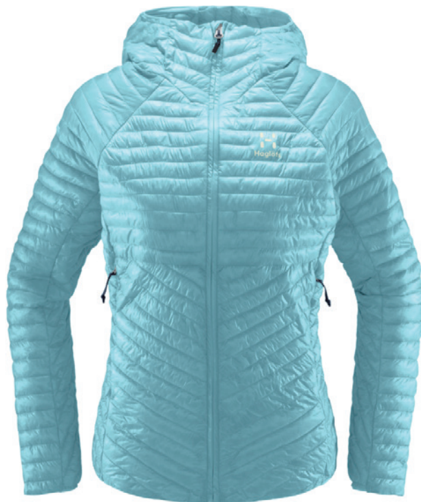
4Q3 Frost Blue