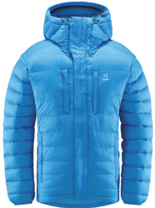
■ 4Q6 Nordic Blue