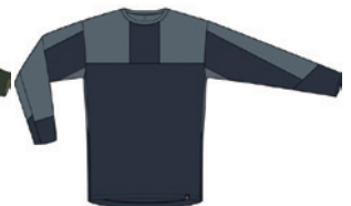
4XA Tarn Blue/Steel Blue