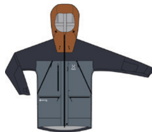
4X9 Steel Blue/Tarn Blue