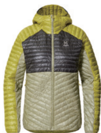
5OT Aurora/Thyme Green