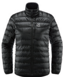
2C5 True Black