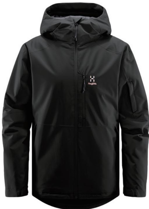
2C5 True Black