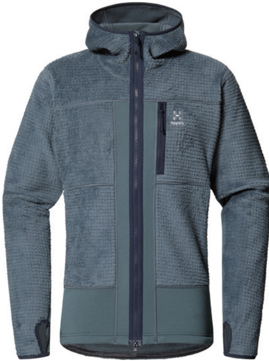
216 Steel Blue