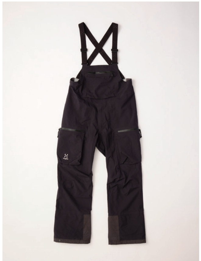
2C5 True Black