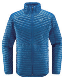
■ ■ ■ 4Q6 Nordic Blue