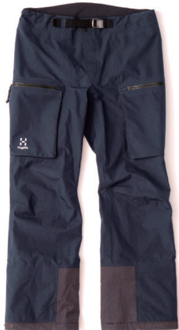
3N5 Tarn Blue