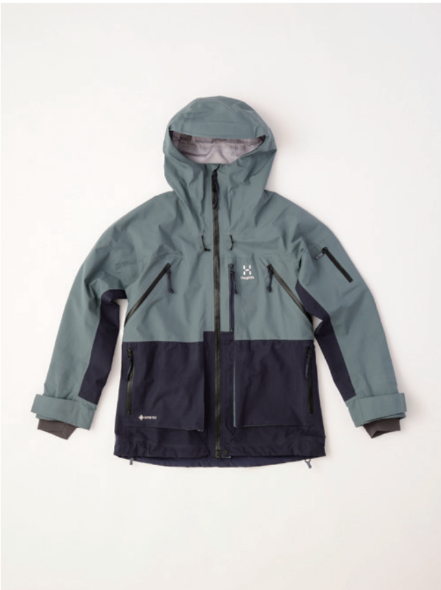
4X9 Steel Blue/Tarn Blue