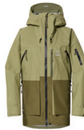
4WY Thyme Green/Olive Green