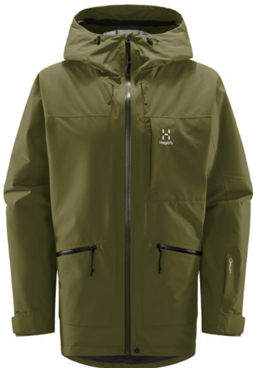
4VY Olive Green