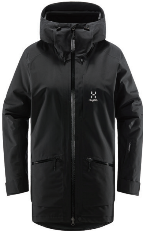
2CS True Black