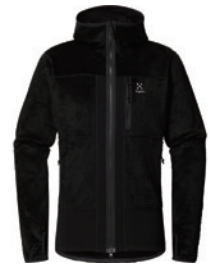
2CS True Black