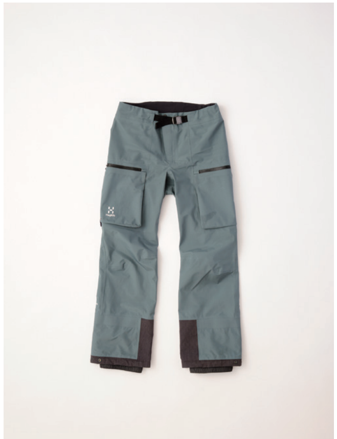
216 Steel Blue