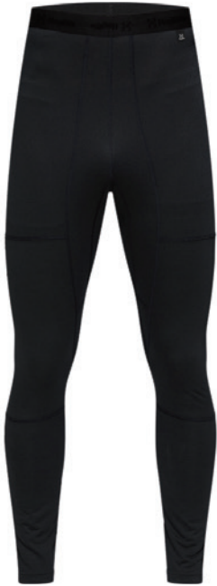
2C5 True Black