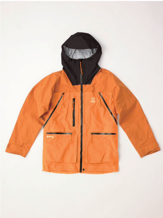
5LX Desert yellow/Golden brown