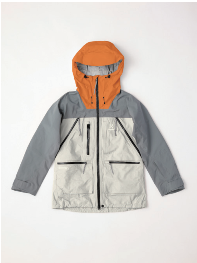
5PM Steel Blue/Stone Grey