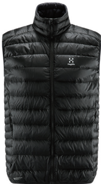
2C5 True Black