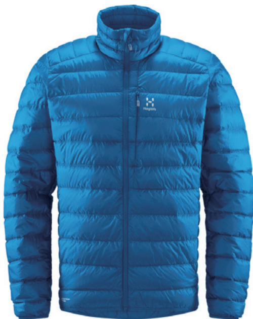
4Q6 Nordic Blue