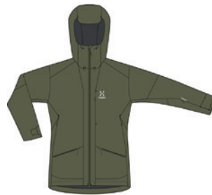
4VY Olive Green