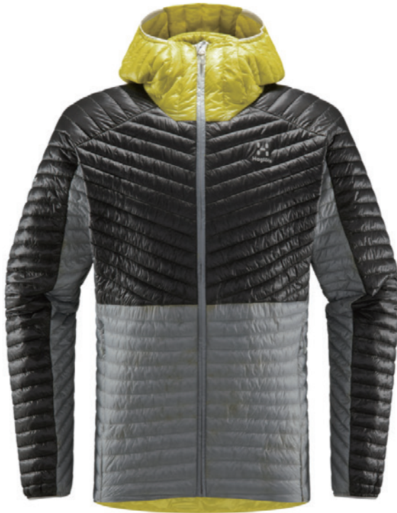
■ ■ ■ 3XM Stone Grey/Magnetite