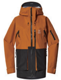
5PG Golden Brown/True Black