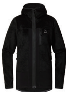
2C5 True Black