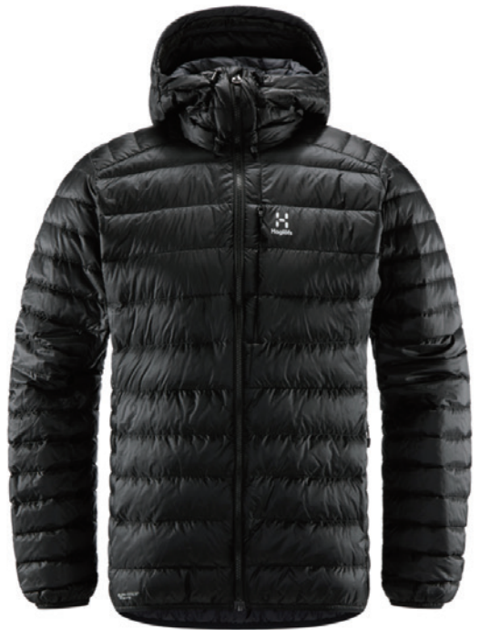
2C5 True Black