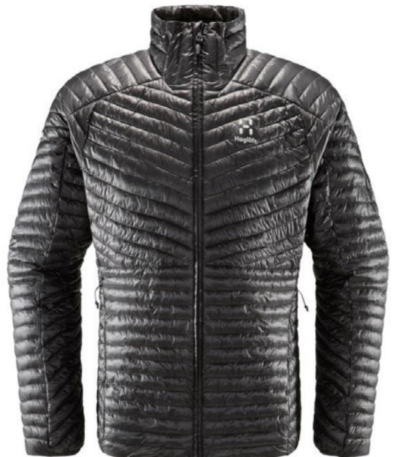
■ ■ ■ 2AT Magnetite