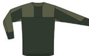
5MZ Seaweed green/Olive green