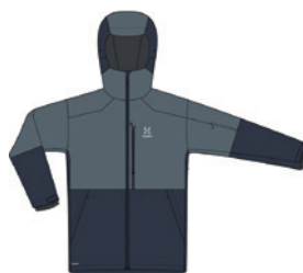
4XA Tarn Blue/Steel Blue