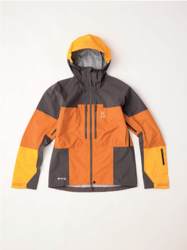
■ 5M0 Golden brown/Magnetite