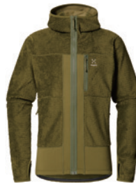
4VY Olive Green