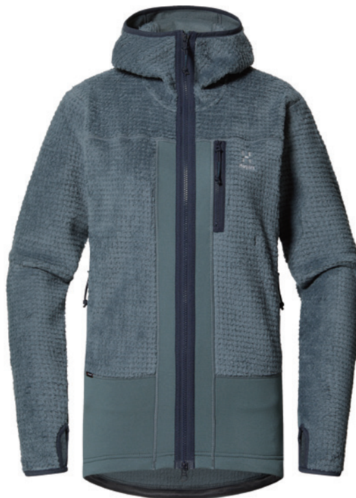
216 Steel Blue