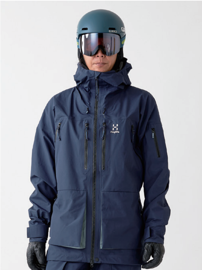
4XA Tarn Blue/Steel Blue