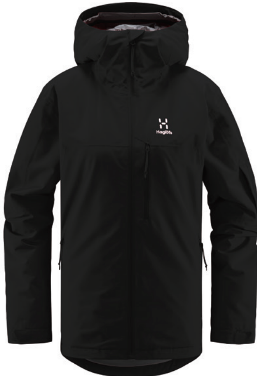
2CS True Black