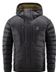
■ 2AT Magnetite