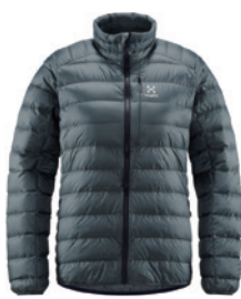
216 Steel Blue