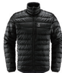
2C5 True Black