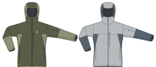
4WY Thyme Green/Olive Green