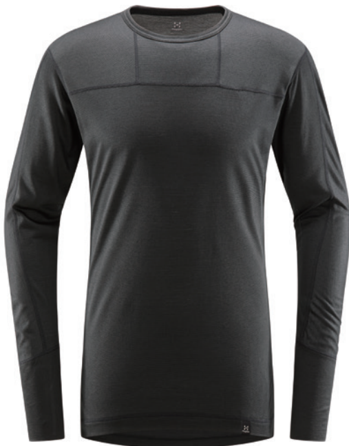
2CS True Black