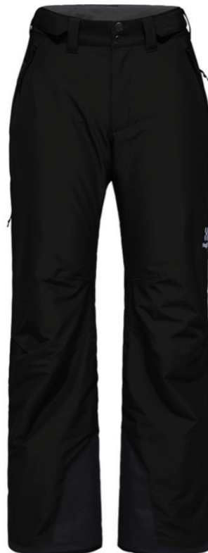
2C5 True Black