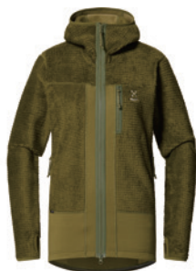
4VY Olive Green