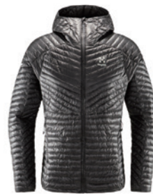
■ ■ ■ 2AT Magnetite