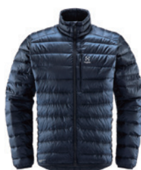
3N5 Tarn Blue