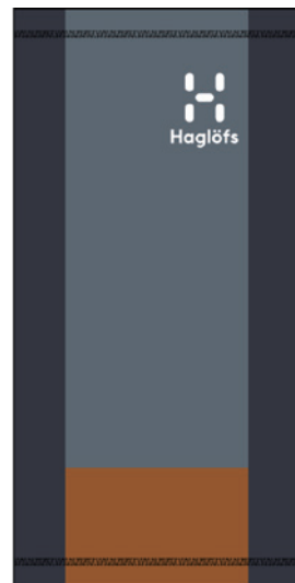
4X9 Steel Blue/Tarn Blue