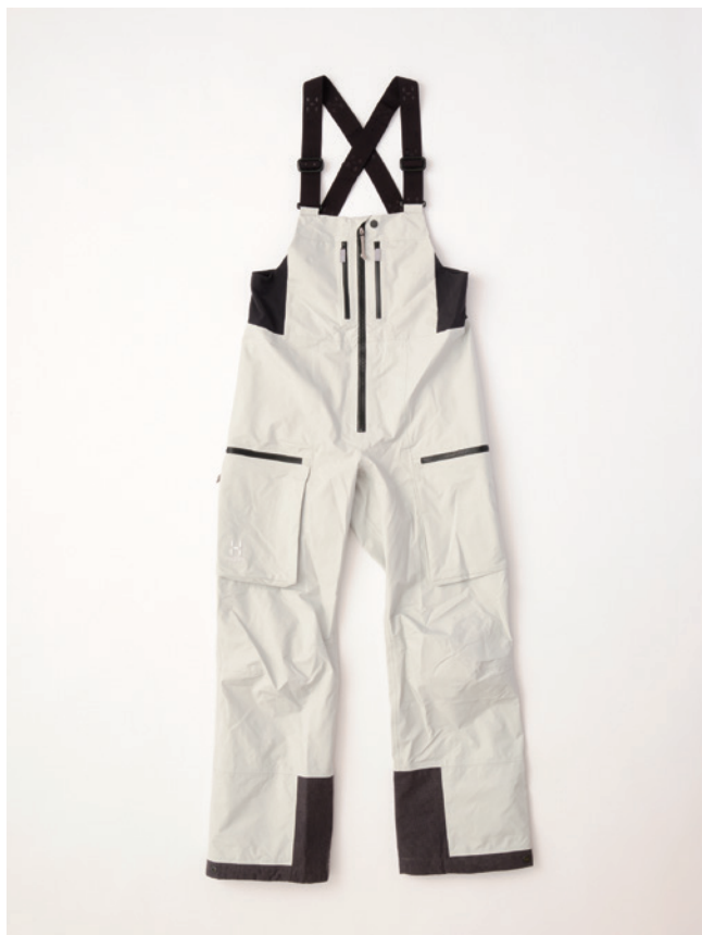
3X3 Stone Grey