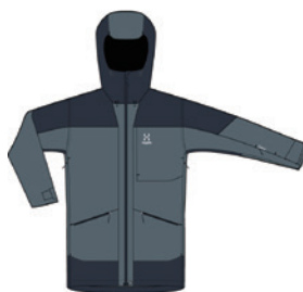
4X9 Steel Blue/Tarn Blue