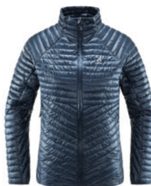
3N5 Tarn Blue