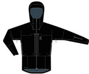
■ 2C5 True Black