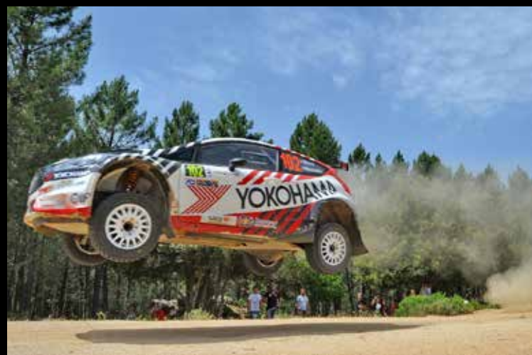
Gigi Ricci - Championnat des Rallyes Terre Italie - Sardaigne 2015