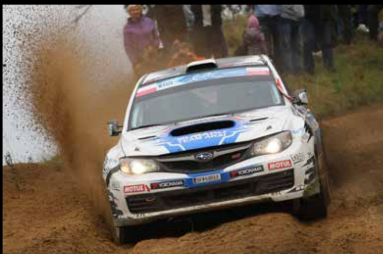
YOKOHAMA partenaire 2013 en E.R.C.