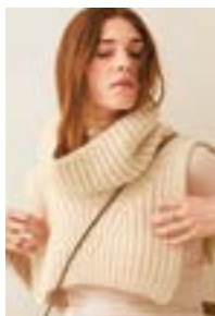
STELLA NECK Alpakka Ull + Tynn Silk Mohair Design 2