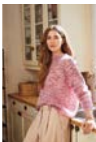
DEBUTANT SWEATER Tynn Silk Mohair x2 Design 5