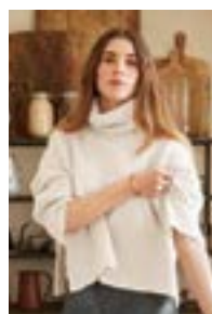
ABBY SWEATERKOS EDITION Kos Design 9

EVENTUELLE RETTELSE TIL DETTE HEFTET FINNER DU PÅ SANDNESGARN.NO