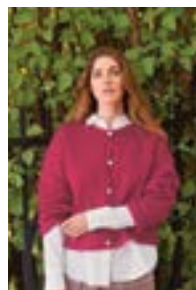
DEBUTANT CARDIGAN Tynn Silk Mohair x2 Design 3