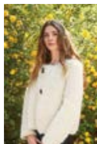
AYA JACKET Børstet Alpakka Design 6