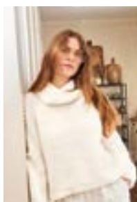
STELLA SWEATER Alpakka Ull + Tynn Silk Mohair Design 8