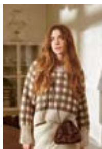
GINGHAM SWEATER Peer Gynt Design 4