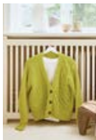
ARTISANECARDIGAN Double Sunday + Tynn Silk Mohair Design 1