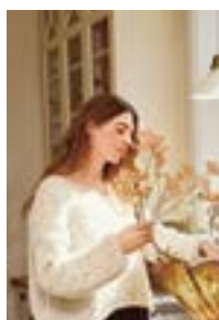
FACILE SWEATER Børstet Alpakka x2 Design 7