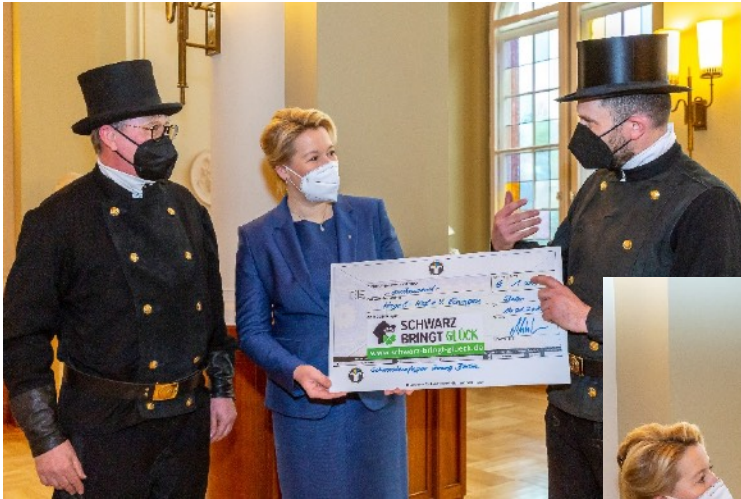
in Vertretung Landesinnungsverband Niedersachsen Pressesprecher: Andreas Walburg