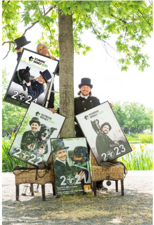
Wahlweise mit Hund oder Katze, die Bilder wurden im Tierheim Berlin und in Geltow geschootet.