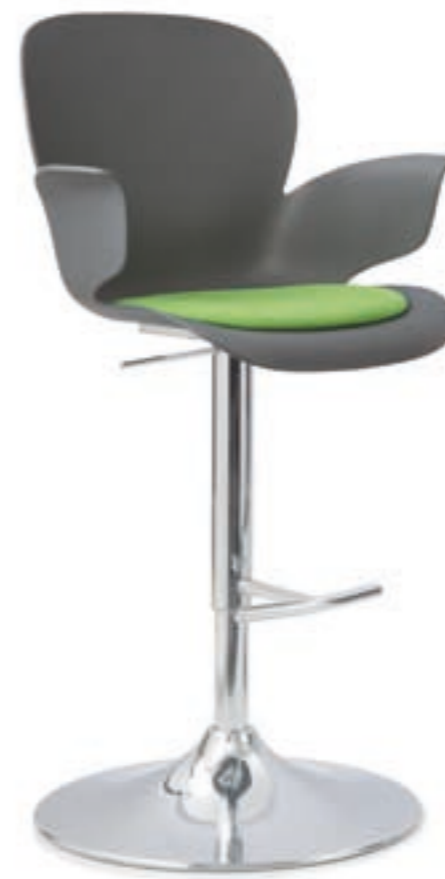
CALIXO® Counter. Höhereinstellbar mit Tellerfuß verchromt. Schale in Schilfgrün, Silbergrau-Metallic oder Naturweiß. Mit Sitzpolster oder TUBE.

CALIXO® stapelbare sledeframe, met een onderstel in chroom of zwart. Schaal leverbaar in licht groen, zilvergrijs metallic of natuur wit. Met zitopdekje of gestoffeerd in TUBE.