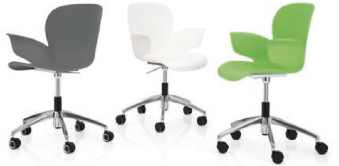
CALIXO® Drehstuhl höhengestellbar auf Rollen ohne Polsterung. CALIXO® In hoogte verstelbare draaistoel op wielen, zonder stoffering.

CALIXO® in hoogte verstelbare draaistoel op wielen. Aluminium voetenkruis. Schaal leverbaar in licht groen, zilvergrijs metallic of natuur wit. Met zitopdekje of gestoffeerd in TUBE.