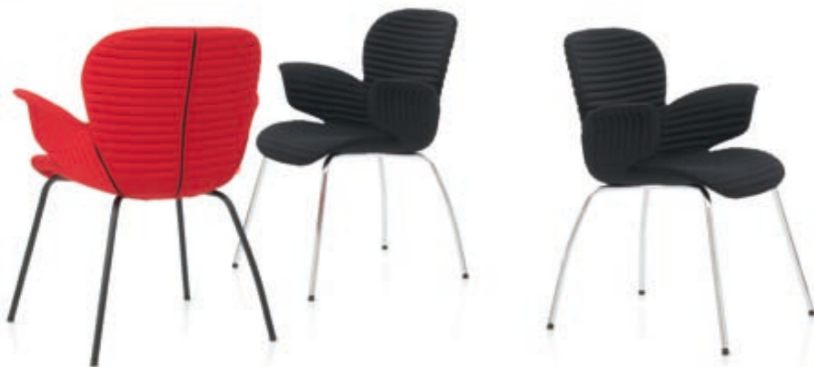
CALIXO® Vierbeingestell in TUBE. CALIXO® Vierpoot in volledig gestoffeerd in TUBE.