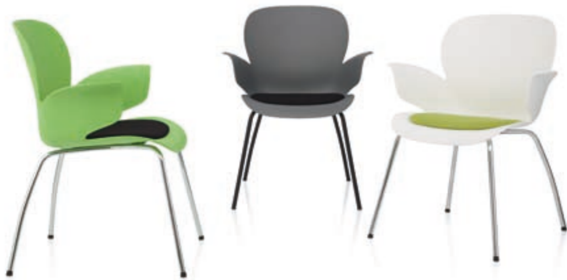
CALIXO® Vierbeinstuhl mit Sitzpolster. CALIXO® Vierpootstoel met zitopdekje.