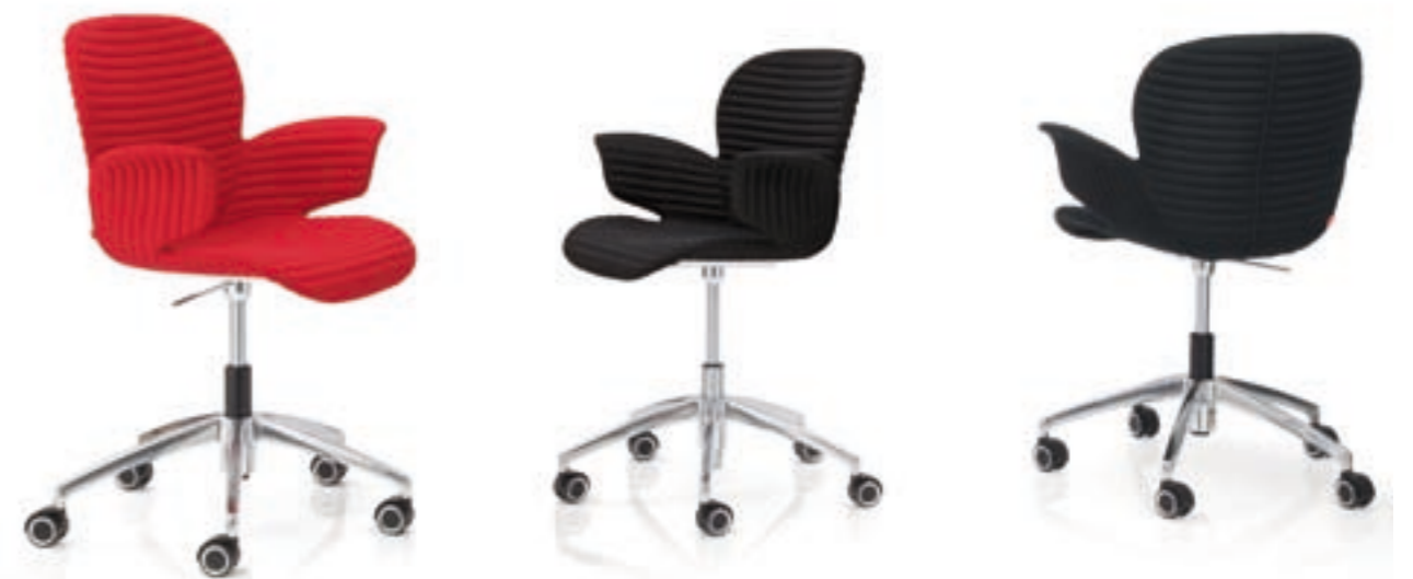
CALIXO® Drehstuhl höhengestellbar auf Rollen in TUBE. CALIXO® In hoogte verstelbare draaistoel op wielen in volledige TUBE stoffering.