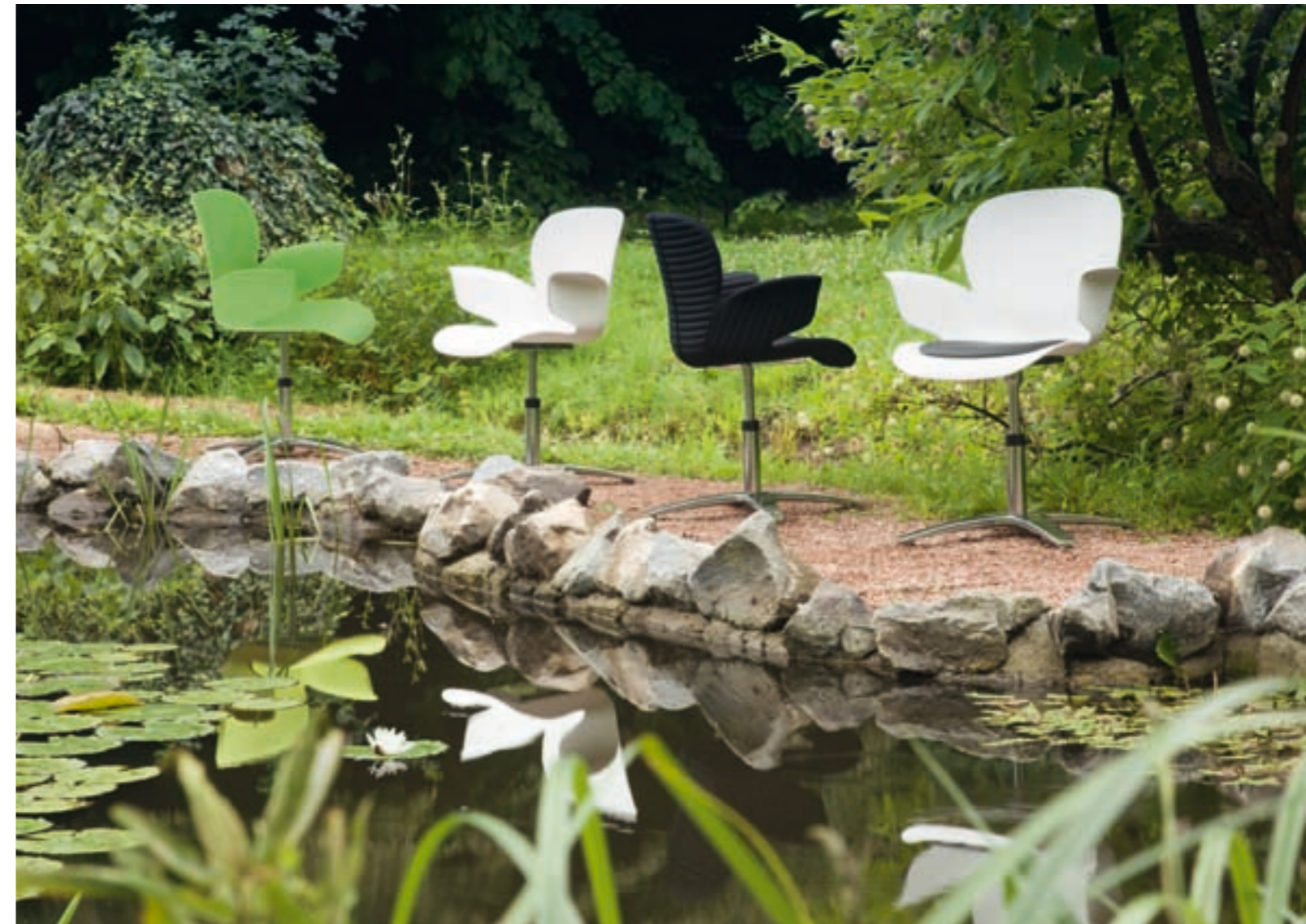
CALIXO® Drehstuhl auf 4-strahligem Aluminiumfußkreuz poliert. Schale in Schilfgrün, Silbergrau-Metallic oder Naturweiß. Mit Sitzpolster oder TUBE. CALIXO® Draaistoel op een vierpoot aluminium gepolijst voetenkruis. Schaal leverbaar in licht groen, zilvergrijs metallic of natuur wit. Met zitopdekje of gestoffeerd in TUBE.