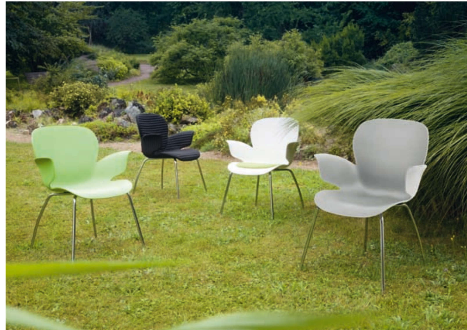
CALIXO® Vierbeinstuhl. Gestell in Chrom oder Schwarz Schale in Schilfgrün, Silbergrau-Metallic oder Naturweiß. Mit Sitzpolster oder TUBE. CALIXO® vierpootstoel, met een onderstel in chroom of zwart. Schaal leverbaar in licht groen, zilvergrijs metallic of natuur wit. Met zitopdekje of gestoffeerd in TUBE.