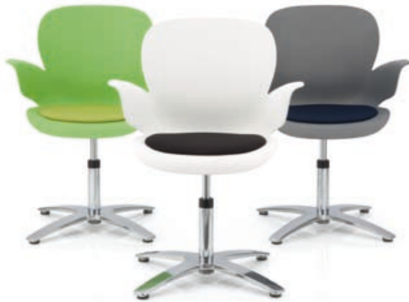
CALIXO® Drehstuhl auf 4-strahligem Fußkreuz mit Sitzpolster. CALIXO® Draaistoel op vierpoot voetenkruis, met zitopdekje.