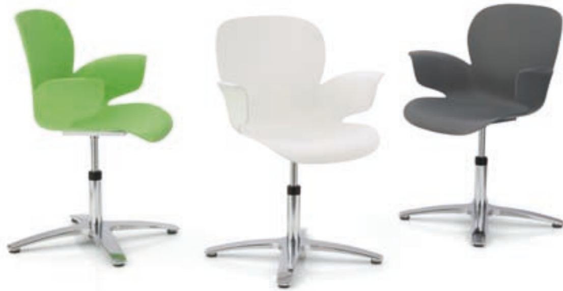
CALIXO® Drehstuhl auf 4-strahligem Fußkreuz ohne Polsterung. CALIXO® Draaistoel op vierpoot voetenkruis, zonder stoffering.