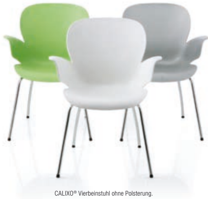
CALIXO® Vierbeinstuhl ohne Polsterung. CALIXO® Vierpootstoel zonder stoffering.