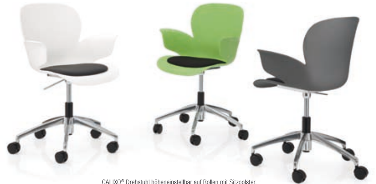
CALIXO® Drehstuhl höhengestellbar auf Rollen mit Sitzpolster. CALIXO® In hoogte verstelbare draaistoel op wielen, met zitopdekje.