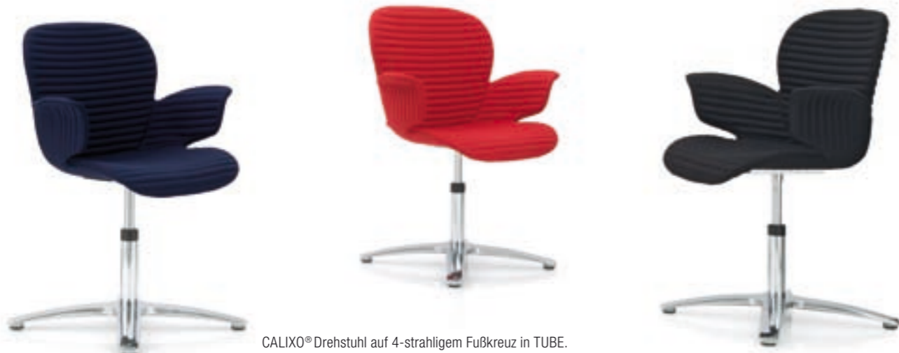
CALIXO® Drehstuhl auf 4-strahligem Fußkreuz in TUBE. CALIXO® Draaistoel op vierpoot voetenkruis in volledige TUBE stoffering.