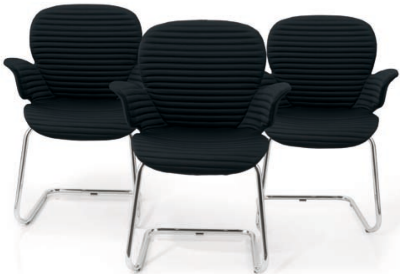
CALIXO® Schwingergestell stapelbar. Gestell in Chrom oder Schwarz. Schale in Schilfgrün, Silbergrau-Metallic oder Naturweiß. Mit Sitzpolster oder TUBE.

CALIXO® stapelbare sledeframe, met een onderstel in chroom of zwart. Schaal leverbaar in licht groen, zilvergrijs metallic of natuur wit. Met zitopdekje of gestoffeerd in TUBE.