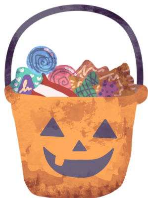
Chaudière de bonbons