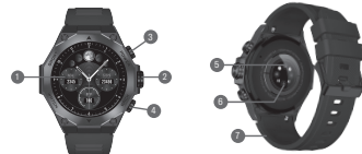
DIAGRAMA DE PRODUCTO