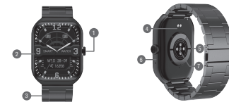
DIAGRAMA DE PRODUCTO