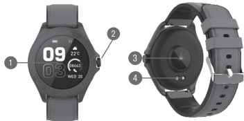
DIAGRAMA DE PRODUCTO