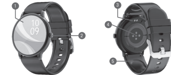
DIAGRAMA DE PRODUCTO