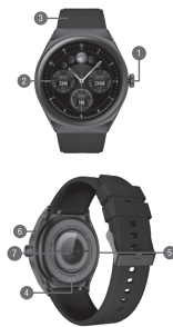
DIAGRAMA DE PRODUCTO