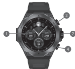
DIAGRAMA DE PRODUCTO