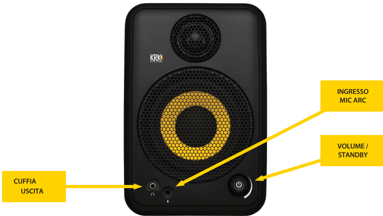
Immagine - GoAux 4 mostrato (GoAux 3 è simile).