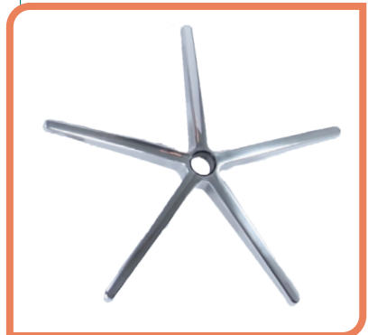
Base en étoile