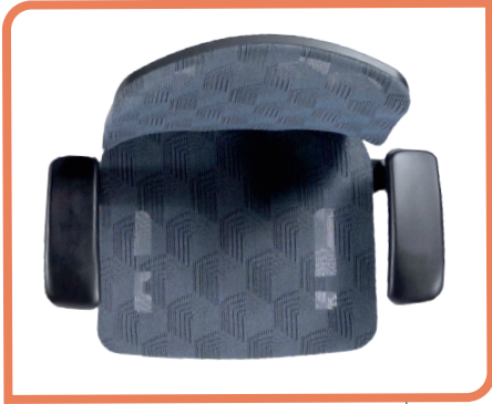
Dossier et assise