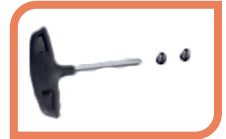
Clé Allen Vis x2