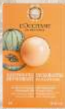
Маска для лица Дыня 6 мл