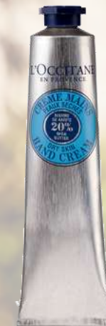
Крем для рук Карите 75мл.