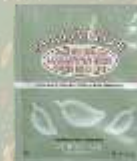
Скраб для тела Миндаль 15 гр.