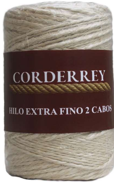
HILO EXTRA FINO 2 CABOS Aprox. 470 grs. 235 mts. 2/1500'/lb

Hilos de Henequén especializados para el uso artesanal y decoraciones de todo tipo.