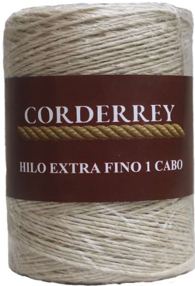
HILO EXTRA FINO 1 CABO Aprox. 470 grs. 378 mts. 1/1200'/lb.