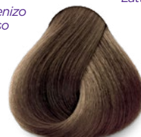
8.11 Light Intense Ash Blonde Rubio Claro Cenizo Intenso