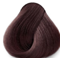
4.65 Burgundy Borgoña