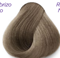
9.11 Very Light Intense Ash Blonde Rubio Clarísimo Cenizo Intenso