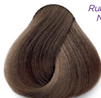
7.35 Cappuccino Capuchino