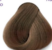
7.31 Latte Macchiato Latte Macchiato