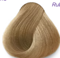
9 Very Light Blonde Rubio Clarísimo