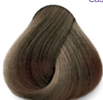
7 Medium Blonde Rubio