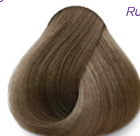
8 Light Blonde Rubio Claro