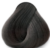
3 Dark Brown Castaño Oscuro