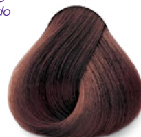
5.45 Mocha Moka