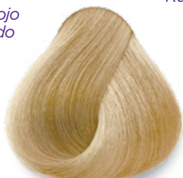
10 Extra Light Blonde Rubio Extra Claro