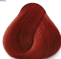
6.66 Dark Intense Red Blonde Rubio Oscuro Rojo Intenso