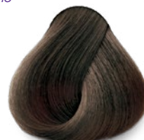
6 Dark Blonde Rubio Oscuro