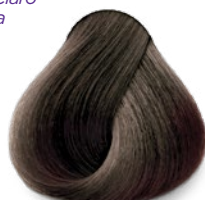
7.11 Medium Intense Ash Blonde Rubio Cenizo Intenso