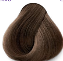
6.23 Dark Beige Golden Blonde Rubio Oscuro Nacarado Dorado