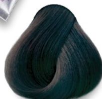
1A Blue Black Negro Azulado