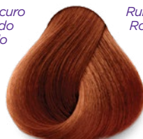
7.44 Medium Intense Copper Blonde Rubio Cobrizo Intenso