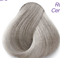
10.1 Extra Light Ash Blonde Rubio Extra Claro Cenizo