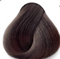
5.31 Chocolate Chocolate