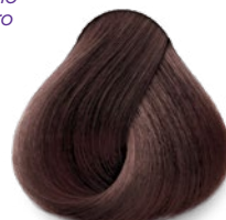
5.5 Light Mahogany Brown Castaño Claro Caoba