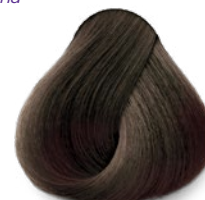
6.1 Dark Ash Blonde Rubio Oscuro Cenizo