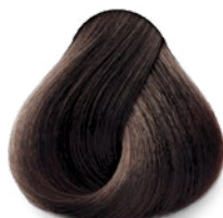
5 Light Brown Castaño Claro