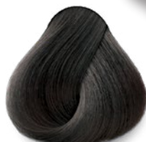
1 Black Negro