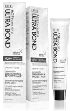
2 fl oz | 60 ml