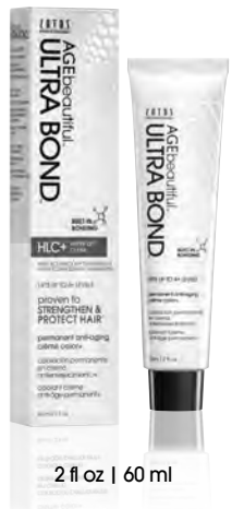
2 fl oz | 60 ml