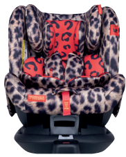
Hear Us Roar CT4418