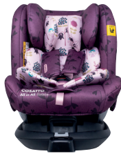
Fairy Garden CT4242