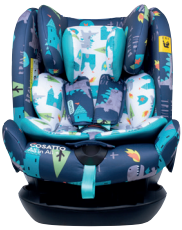
Dragon Kingdom CT4262