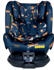
On The Prowl CT4451