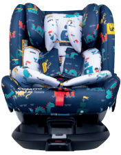
Sea Monsters CT4263