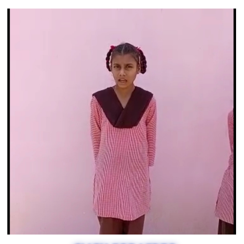
CLICK FOR VIDEO