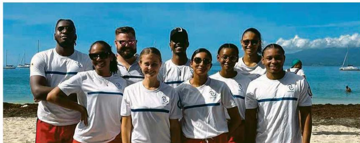
L'équipe des sauveteurs de l'Unass Guadeloupe.

Une communication digitale millimétrée, des soutiens et partenariats représentatifs d'une Guadeloupe multiculturaliste, autour d'eux, les membres de l'Unass Guadeloupe ont su fédérer et rassembler. Cet événement sera l'occasion pour le grand public de