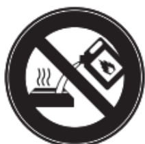
高温時の燃料注入禁止