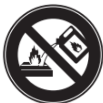
燃焼中の燃料注入禁止