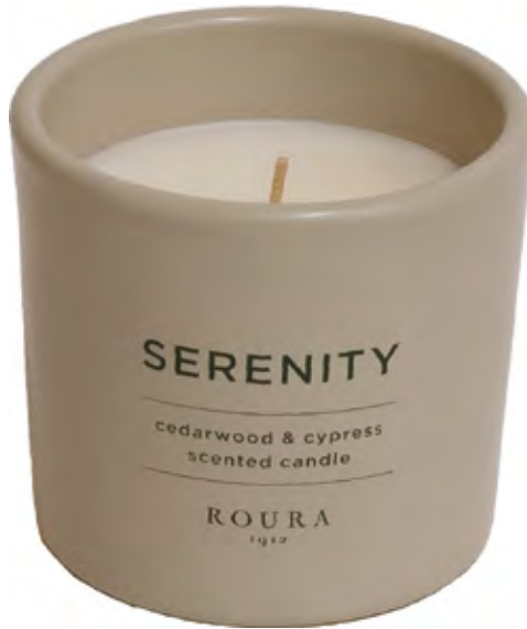
VASO PERFUMADO SERENITY CEDARWOOD & CYPRESS