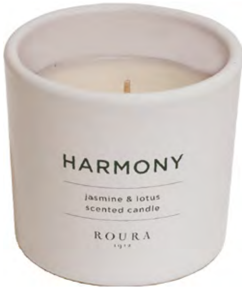
VASO PERFUMADO HARMONY JASMINE & LOTUS

Collection inspirée par le bien-être physique et émotionnel, dans un mode de vie sain et axée sur les soins personnels et l'environnement dans lequel nous habitons. Des parfums très aromatiques conçus pour être à l'aise à la maison, créant un espace pour réfléchir, se reposer, se ressourcer en énergie et en émotions.