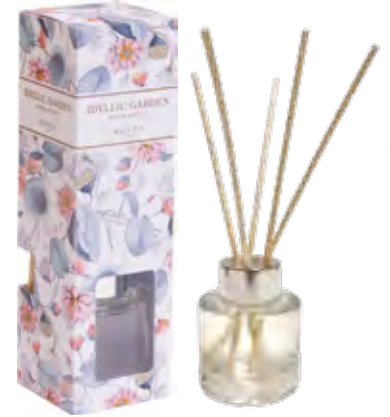
DIFUSOR 50ml IDYLLIC GARDEN - ROYAL PEONY Ref. 333485.205 - 8412129033142 ↑ 50ml 📦 6u. ⌚ 30d