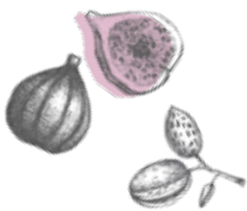
FIG + ALMOND

Perfume que nos traslada a un lugar bajo el sol mediterráneo. El aroma a pulpa de higos, va acompañado por las hojas verdes de la higuera y de fondo la sutileza de las notas lácteas de la almendra que le dan ese toque gourmand.