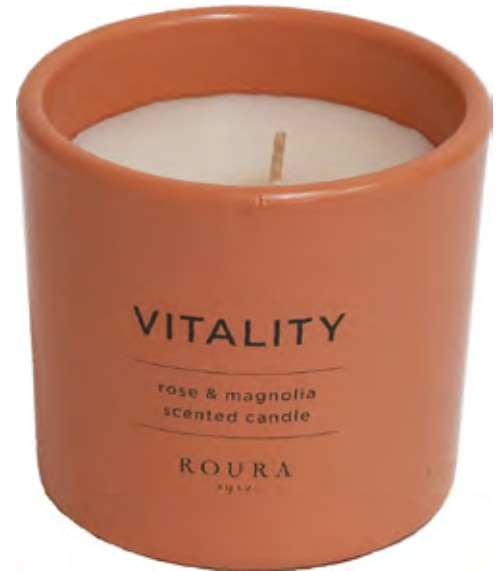
VASO PERFUMADO VITALITY ROSE & MAGNOLIA