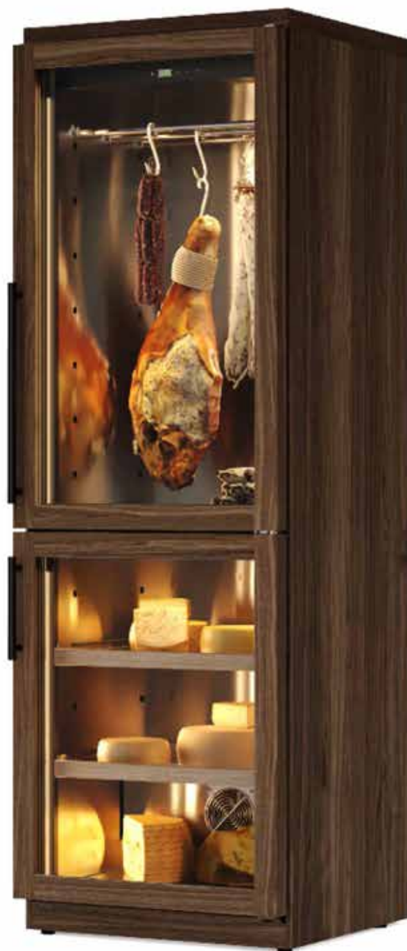
Nell'immagine colore noce canaletto In the picture walnut canaletto color version