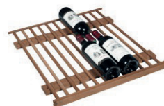
Ripiano in legno a grande carico: fino a 52 bott.