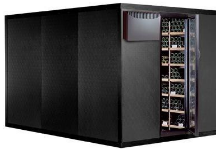
Cabina Clima 3090 Capacità Bottiglie: 3090