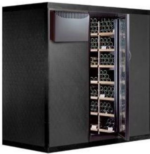
Cabina Clima 990 Capacità Bottiglie: 990