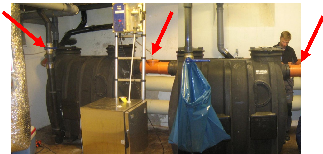
Provpunkterna är markerade med röda pilar i bilden ovan. OBS! Fotomontage.

Inför installationen av avfallskvarn och slamtank tömdes fettavskiljaren och anslutande ledningar renspolades. Vattenprover togs tidsstyrt på tre punkter i anläggningen: inkommande till slamtanken, mellan slamtank och fettavskiljaren samt utgående från fettavskiljaren. Provtagningarna genomfördes som dygns- eller dagsprovtagningar och pågick då under den tid det var verksamhet i restaurangen. Vid samtliga provpunkter användes vakuumprovtagare och proverna kylförvarades på plats i anläggningen samt under leverans till laboratoriet. Samtliga provpunkter är placerade på sådant sätt att inget vatten finns tillgängligt för provtagning under de perioder då vatten inte lämnar anläggningen. Proverna analyserades av Eurofins med avseende på suspenderat material, biologisk och kemisk syreförbrukning, totalfosfor, totalkväve samt avskiljbart fett.