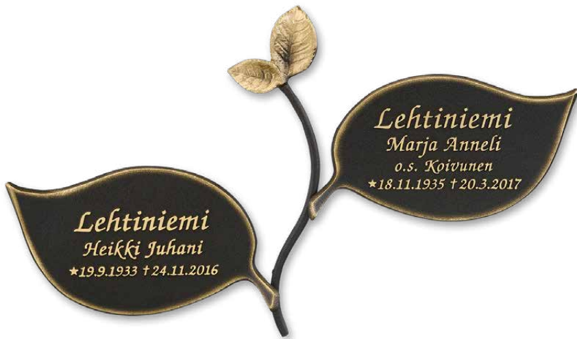
▲ A. Köynnösvarsi, isompi lehti oikealla