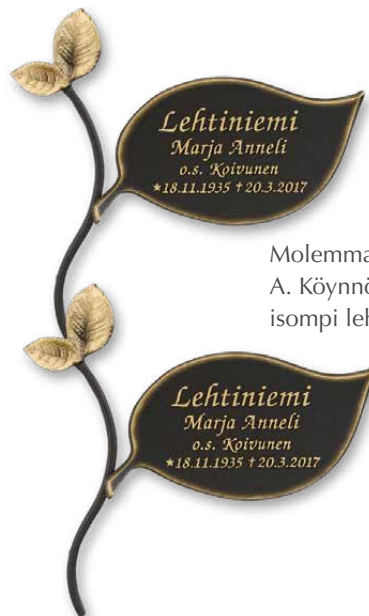
Molemmat köynnösvarret A. Köynnösvarret, isompi lehti oikealla