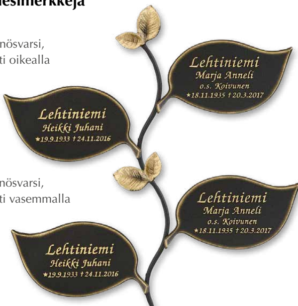
➤ B. Köynnösvarsi, isompi lehti vasemmalla