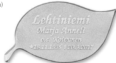
▲ kokonaan kromattuna