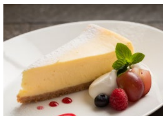
New York Cheese Cake