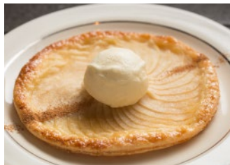
Original Home Made Apple Pie